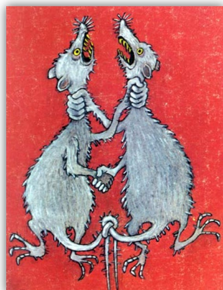
Dessin d'Alexandre Zinoviev

Pendant, cet élargissement de la coopération aux réseaux d'acteurs n'est pas sans faille. En effet, elle empiète sur un autre concept théorique : celui des stratégies collectives (Astley & Fombrun, 1983) qui étudie les relations de coopération entre des acteurs concurrents. La question du nombre des acteurs est donc importante car elle permet de poser la frontière de la coopération, et donc de savoir dans quel cas il s'agit de coopération et non de stratégies collectives. Si l'on part du constat que les stratégies collectives nécessitent la mise en place d'institutions de régulation (Granata, 2010), la coopération englobe certains cas de coopération dans des réseaux de concurrents qui ne peuvent pas être analysés à l'aide des stratégies collectives. Dagnino & Padula (2002) en arrivent ainsi à la conclusion que la coopération est un système (et non plus une dyade) d'acteurs qui interagissent sur la base d'une congruence partielle des intérêts et des objectifs. Cette définition permet donc de montrer que si