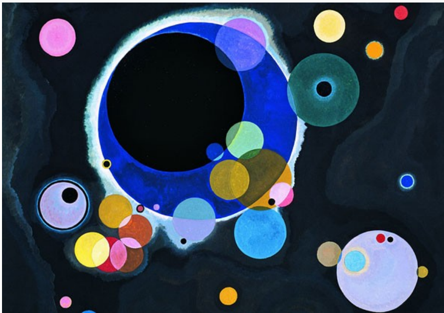
Vassily Kandinsky, Einige Kreise, détail (1926)