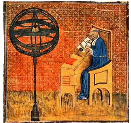
Nicolas Oresme et une représentation aristotélicienne du monde

Jusqu'ici j'ai seulement soutenu que les paradigmes sont les éléments constitutifs de la science. Je voudrais maintenant montrer qu'en un sens ils sont aussi les éléments constitutifs de la nature. (cité in Read, 2003)