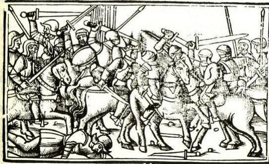
Siège de Pavie avec la défaite et capture du roi très chrétien , 1525.