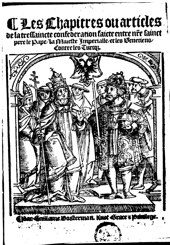
Les Chapitres de la Ligue Chrétienne, Paris.