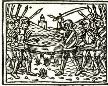
Francesco Mantovano, Le déroulement de la guerre de Pavie , 1524 ? (avant le dénouement).