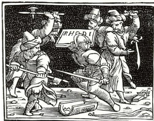
Lamentation de Rhodes qui invite toute la Chrétienté à s'unir contre les païens, vers 1530. (Œuvre composée à la suite du siège et de la reddition de Rhodes en 1522)

El lamento de 'Rhodi el qual conuoca tutta la christianita adunarsi insieme cōtra pagani.