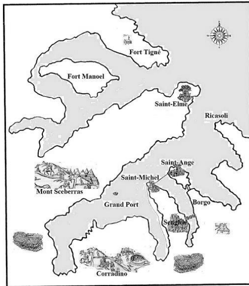
Les lieux évoqués dans le grand siège de Malte