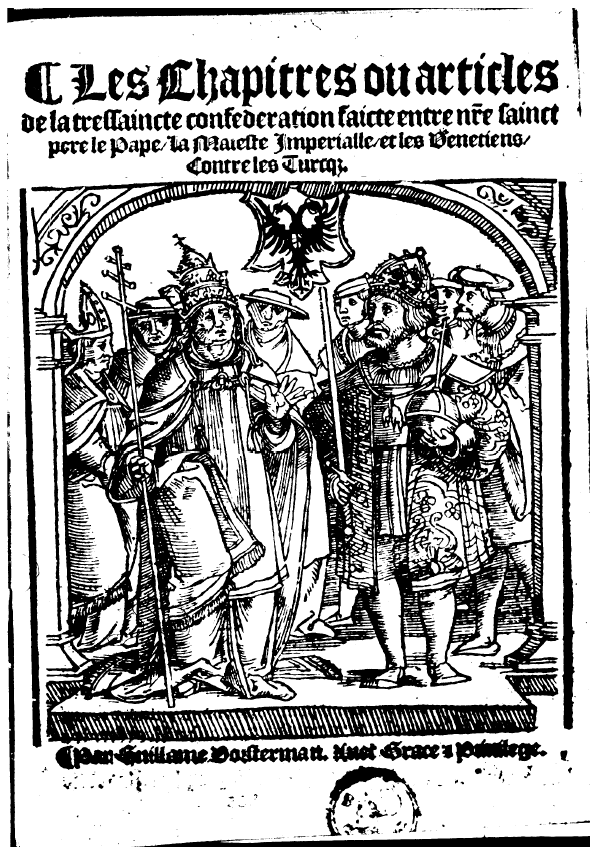
Les Chapitres de la Ligue Chrétienne, Paris.