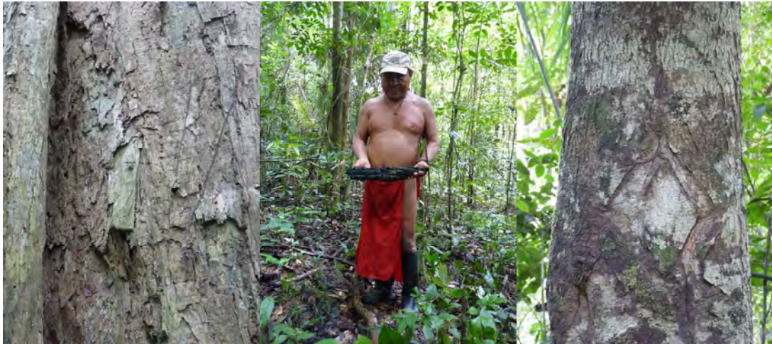
Fotos 3,4,5: as marcas de ocupação na região da antiga aldeia Parapisinã (arvore Tawari com casca arrancada para confeccionar cigarros, fragmento de carvão oriundo da queimada de roças, marcas de facão na casca de uma arvore).

ficou muito feliz que tenhamos conseguido achar esse lugar, que confirmava perfeitamente os relatos dos antigos em relação à sua posição.