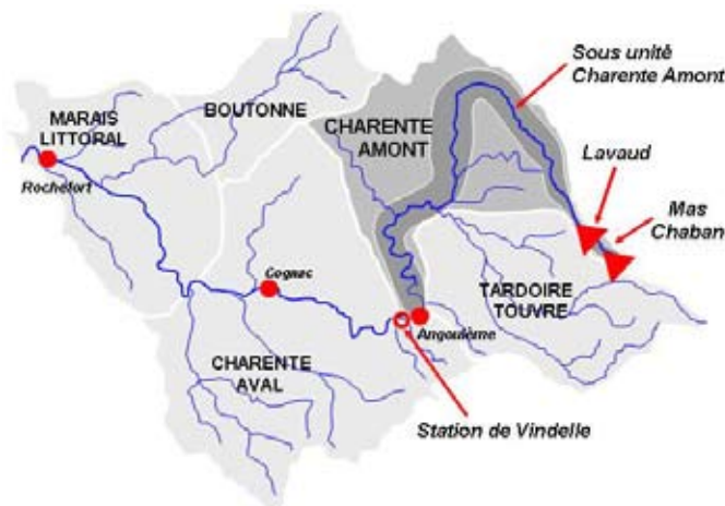
Figure 2 : Sous unité de la Charente amont

représente 1/3 de la SAU). Sous les effets conjugués de la politique agricole commune et de politiques locales favorables au développement de l'irrigation, la superficie irriguée a été multipliée par 20 en 30 ans et 85 % de cette superficie concerne du maïs. Le bassin étudié ici est la Charente amont dite « restreinte » (figure 2), constitué du fleuve et de sa nappe d'accompagnement, où d'importants déséquilibres s'observent malgré un fort développement d'infrastructures de soutien d'étiage. Dans ces conditions, le rendement des cultures irriguées est affecté, la vie aquatique est mise en péril, le développement touristique est difficile, l'activité ostréicole à l'aval du bassin peut être remise en cause et l'alimentation en eau potable de certaines agglomérations est perturbée.