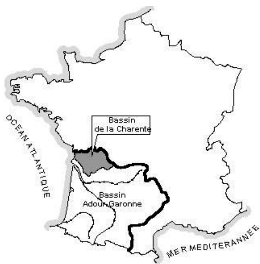
Figure 1 : Bassin de la Charente