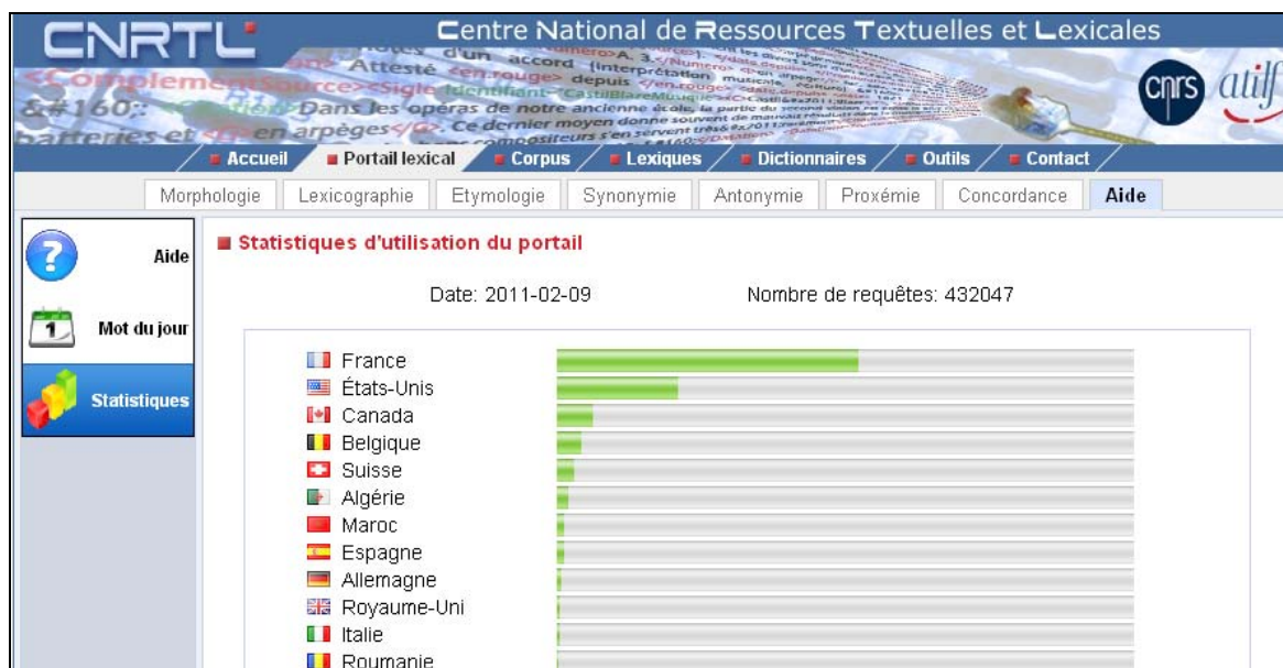
Figure 7 : Statistique d'usage du portail lexical du CNRTL

Son intégration plus récente encore dans le portail lexical du CNRTL et ses interconnexions avec d'autres types de ressources sur le vocabulaire français le positionnent au cœur d'un ensemble de ressources sur la langue française où il joue un rôle actif et prépondérant, démontrant ainsi que sa réputation élitiste est devenue largement injustifiée. Sa diffusion au sein du portail lexical du CNRTL ( www.cnrtl.fr/portail ) en fait aujourd'hui l'un des dictionnaires les plus exploités sur le Web : d'environ 350 000 requêtes par jour (cf. Figure 7).