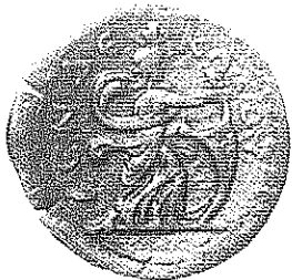
Fig. 4: Isis à la voile. Alexandrie. Drachme de l'an 11 d'Antonin [147/8] (coll. L. Bricault).