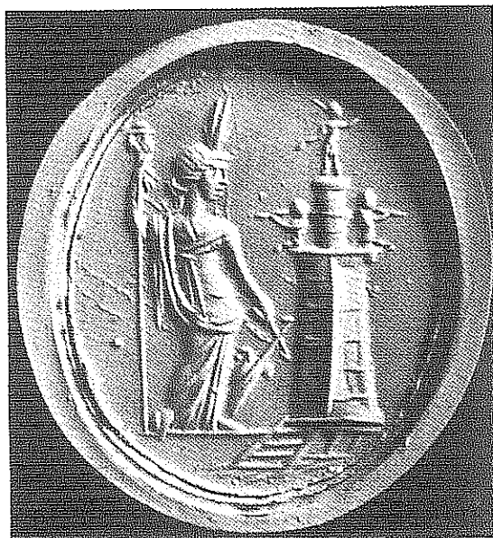
Fig. 5: Isis Pharia. Gemme en verre bleu. [II e siècle après J.-C.]. Kunsthistorisches Museum Wien n° inv. XI 991 (photo de l'empreinte d'après Antike Gemmen , Wien, II, p. 91 n° 973 et pl. 58).