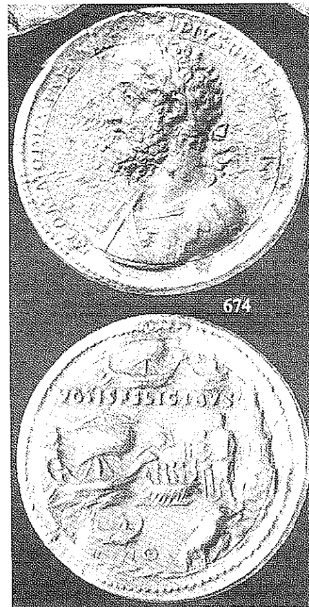
Fig. 3: Médaillon de Commode sacrifiant à Isis Pharia. Rome [25 avril 190] (catalogue Lanz 94 (1999) n° 674).