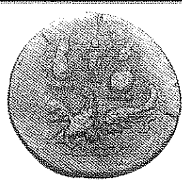
Fig. 2: Sarapis de Canope, Harpocrate de Canope et Isis de Ménouthis. Alexandrie. Drachme de l'an 6 de Faustine [165/6] (catalogue CNG 51 (1999) n° 1014).