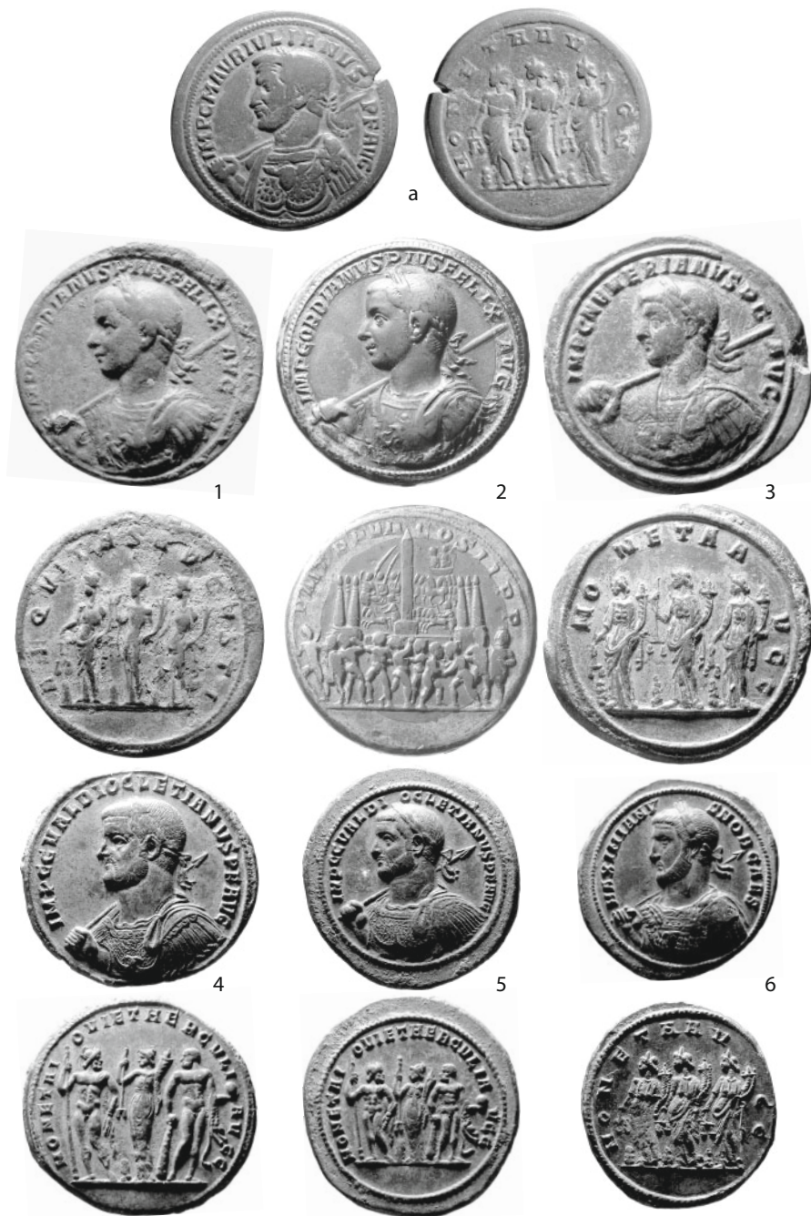
Planche 2 - Buste lauré et cuirassé à gauche, haste sur l'épaule droite – médaillons de comparaison.