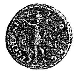
Fig. 6 (voir note 17)

alexandrin et/ou romain, le type avec Sarapis est sans doute davantage une expression idéologique politico-religieuse forte qu'une manifestation de la présence d'un « lobby » isiaque dans l'entourage d'Huviska. Le statère d'or vendu à Paris au printemps dernier (20), d'un poids de 7,44 g, inédit, que l'on rapprochera de la série n° 164, en est un nouvel exemple.