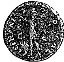
Fig. 6 (voir note 17)

alexandrin et/ou romain, le type avec Sarapis est sans doute davantage une expression idéologique politico-religieuse forte qu'une manifestation de la présence d'un « lobby » isiaque dans l'entourage d'Huviska. Le statère d'or vendu à Paris au printemps dernier (20), d'un poids de 7,44 g, inédit, que l'on rapprochera de la série n° 164, en est un nouvel exemple.