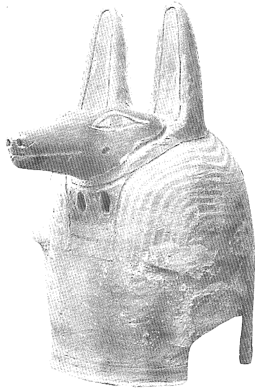
Fig. 2: Pelizaeus-Museum Hildesheim, inv. 1585 (d'après Die Ägyptische Sammlung , Mayence 1993, p. 87)