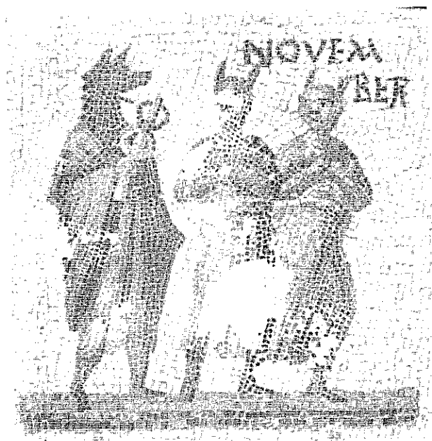
Fig. 5: Mosaïque d'El Djem, Tunisie

reconnaître un homme coiffé du masque d'Anubis sur un vase d'Ittenwiller, en Alsace, datant du règne d'Hadrien 42 .