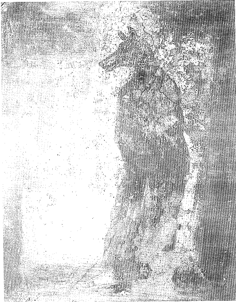
Fig. 1: Naples: Museo Archeologico Nazionale, inv. 8920 (d'après Iside , Milano 1997, p. 426)

d'Égypte donc 21 , a conduit les érudits modernes à s'interroger sur l'antiquité d'une telle pratique et à rechercher ses traces dans la religion de l'Égypte ancienne. Les peintures funéraires abondent en représentations de prêtres masqués à faciès canin, essentiellement lors des rites funéraires requérant la présence vivante d'Anubis, mais pas uniquement 22 . L'aspect thériocéphale quand il n'est pas entièrement zoomorphe de la plupart des divinités égyptiennes justifie aisément le recours au port du masque pour les humains sensés figurer le dieu lui-même 23 . Hors d'Égypte, le panthéon isiaque est quasiment intégralement anthropomorphisé, à l'exception d'Apis, mais son rôle demeure accessoire dans le mythe isiaque, et surtout d'Anubis, qui conserve jusqu'à la fin du paganisme sa tête canine, même si l'image d'Hermanubis apparue à l'époque impériale est entièrement humaine. Cette situation a plusieurs conséquences, dont au moins deux nous intéressent ici: d'une part, la sous-représentation d'Anubis dans l'iconographie isiaque (reliefs, monnaies, statuaire), signe que son aspect de cynocéphale n'a pas séduit les populations non-égyptiennes 24 ; d'autre part, l'obligation qui était faite au fidèle jouant le rôle du dieu, et seulement lui, de porter un masque dans les processions isiaques 25 .