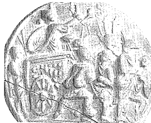
Fig. 3: Metropolitan Museum, New York, inv. D. 94

chacal et, sur le côté gauche, un motif de vigne 39 .