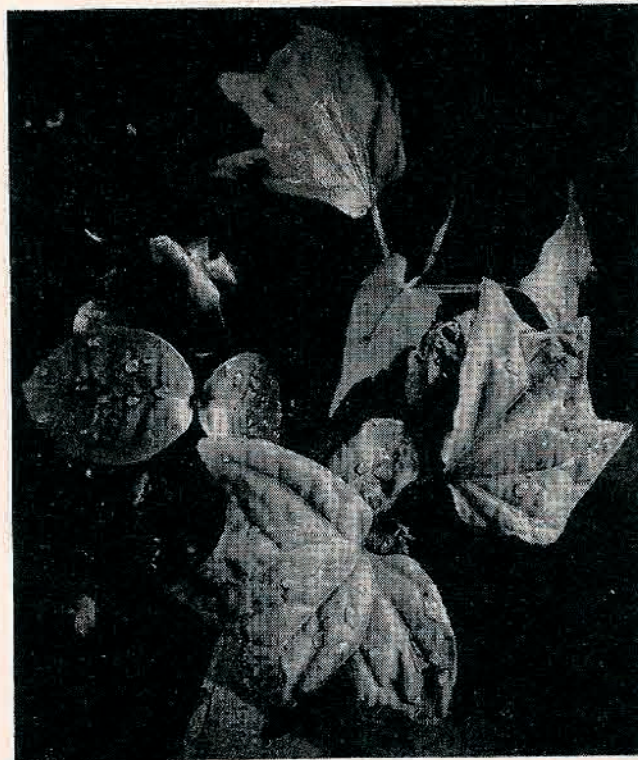
Fig. 2. — Ensemble des germinations issues d'un contenu intestinal de Cercopithecus nictitans .

Nous n'avons pas toujours pu nous procurer de témoins non ingérés, comme l'ont fait les auteurs qui ont expérimenté sur des animaux en captivité. Les graines non ingérées recueillies provenaient des fruits mûrs qui selon nos propres observations, ou les observations les plus vraisemblables des chasseurs, entraient dans l'alimentation des Primates. Ces graines non ingérées ont fourni 15 plantules de 4 espèces seulement parmi les 13 semées.