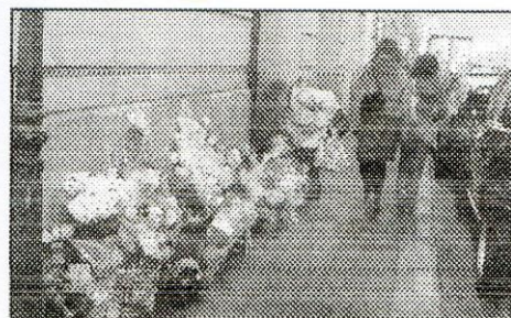
PLACE DE BITCHÉ (PARIS XIX e ), HIER. Les riverains du garage incendié rendent hommage aux deux pompiers décédés.

Tous ont pu regagner leur logement, sous escorte policière, hier en fin de matinée. La portion de rue autour du garage n'a cependant pas été rouverte. Elle pourrait rester fermée plusieurs jours en raison des risques d'effondrements du bâtiment ravagé par les flammes.