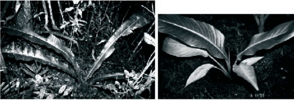
Fig. 1. Jeune ravenala, forme malama , dans la forêt d'Andasibe, et (à droite), une plantule de 10 mois en serre, avec émergence d'une nouvelle feuille à la base du limbe de la 7ème feuille. On remarque que les pétioles sont de plus en plus courts et que la base du limbe est symétrique.