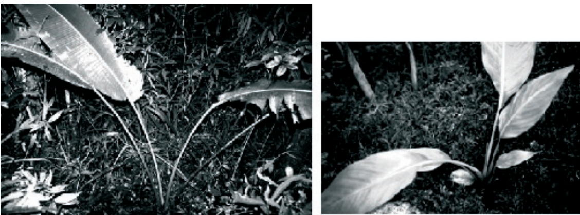
Fig. 2. Jeune ravenala, forme hiranirana , dans la forêt d'Andasibe, et (à droite) une plantule de 8 mois en serre, avec émergence de la 7ème feuille. On remarque que les pétioles sont de plus en plus longs et que la base du limbe est asymétrique.