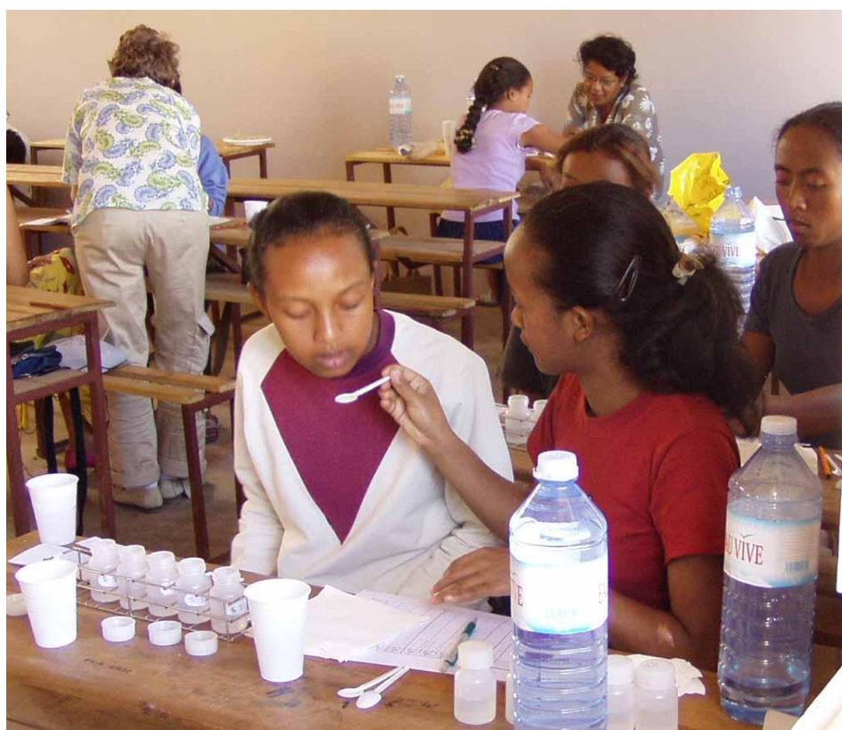
Figure 4. Mesure de la réponse hédonique à des solutions concentrées de saccharose ou de chlorure de sodium, permettant de définir un profil individuel des réponses gustatives en tant que perceptions et appréciations.

Pour mesurer objectivement cet aspect de la perception et de l'appréciation et déterminer les profils gustatifs individuels nous utilisons des échelles de catégorie en 9 points sur lesquelles le sujet situe l'intensité perçue (goût à peine perceptible ou extrême) et le niveau hédonique (aversion ou appréciation).