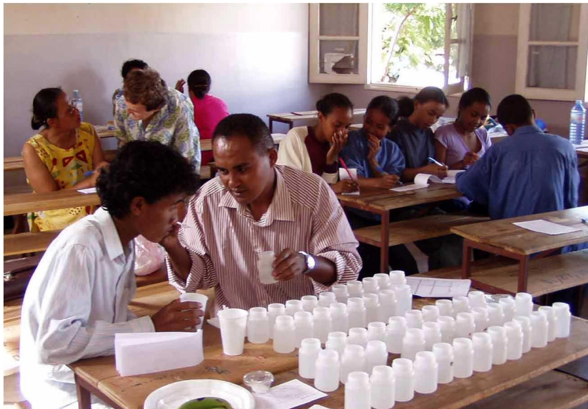
Figure 2. Tests de détermination des seuils de perception gustative dans un Lycée d'Antananarivo. Pour chaque produit, une série de solutions, dans l'ordre décroissant des concentrations, était préparée : fructose (10 dilutions de 1000 à 1 mM/l), saccharose (10 dilutions de 200 à 1,5 mM/l), chlorhydrate de quinine (13 dilutions, de 400 à 0,4 \mu M/l), chlorure de sodium (12 dilutions de 250 à 0,5 mM/l), acide citrique (8 dilutions de 25 à 0,2 à mM/l).

été reprise (Figure 2), en préliminaire des tests de dégustation des ignames, afin de définir un « profil gustatif » des individus testés, utile à l'interprétation des résultats.