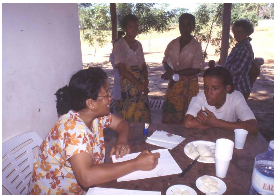
Figure 5. Tests de dégustation d'ignames sauvages sous les formes habituellement consommées, cuites (deux espèces, 'ovy' et 'bako') ou crues (deux autres espèces, 'sosa' et 'babo'), en utilisant une échelle des réponses hédoniques analogue à celle des réponses calibrées avec des substances pures.

hédonique présente souvent un pic à la concentration préférée. Les premiers résultats obtenus à Madagascar ont été reportés sur le Tableau I en utilisant les notations des types proposés en 1977 par Thompson et al. ( sweet likers ). Lorsqu'un sujet porte des notes croissantes, puis une note plus faible pour décrire l'appréciation de la solution la plus concentrée, il est dit "sweet liker de type I". Si le sujet attribue des notes de plus en plus élevées en fonction des concentrations croissantes de sucre, il est appelé "sweet liker de type II". Les autres sujets, plus rares dont les notations décroissent avec les concentrations de sucre sont nommés « sweet dislikers ». Par extension, nous employons des termes comparables pour décrire les amateurs des solutions à goût salé ou amer : respectivement "salt liker" et "PROP liker" (PROP = 6-n-propylthiouracile). Les proportions de ces groupes sont comparées avec les résultats obtenus en France en utilisant un protocole identique (Tableau I). La fréquence des "sweet likers" est plus élevée à Madagascar (total des types I + II = 78 %), alors qu'en France elle atteint seulement 47 %.