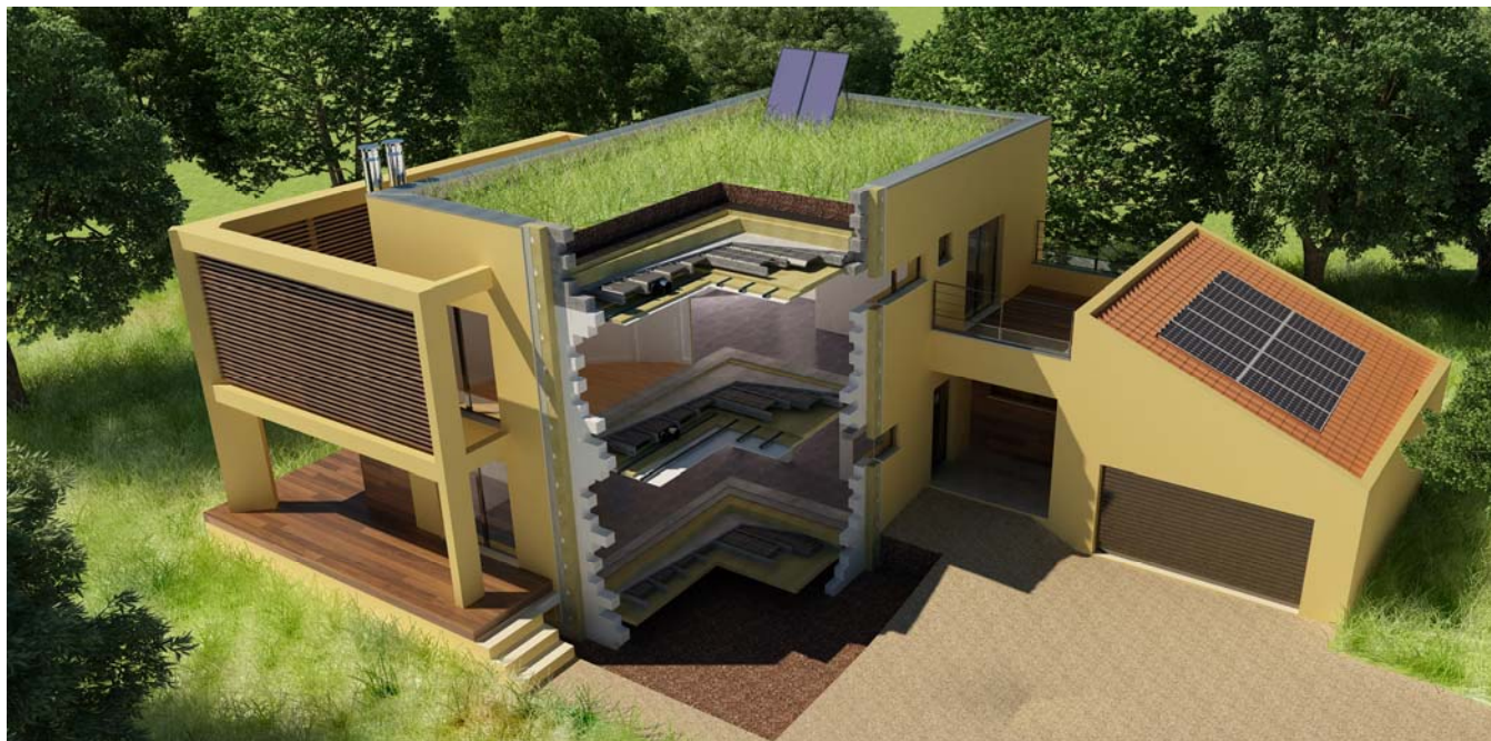
Fig 1 : Maison Respekt : Villa Concept

De ce fait, nous aborderons les compatibilités et incompatibilités liées à la thermique et à l'acoustique du bâtiment à l'aide de mesures acoustiques réalisées sur une maison passive (voir figure 1), nous nous appuyerons de ces résultats pour expliciter quelques systèmes pouvant fonctionner ensemble.