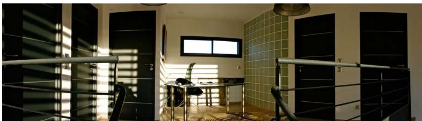
Fig 4 : Villa Concept : étage