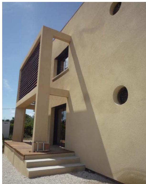
Fig 3 : Villa Concept : Façade Sud