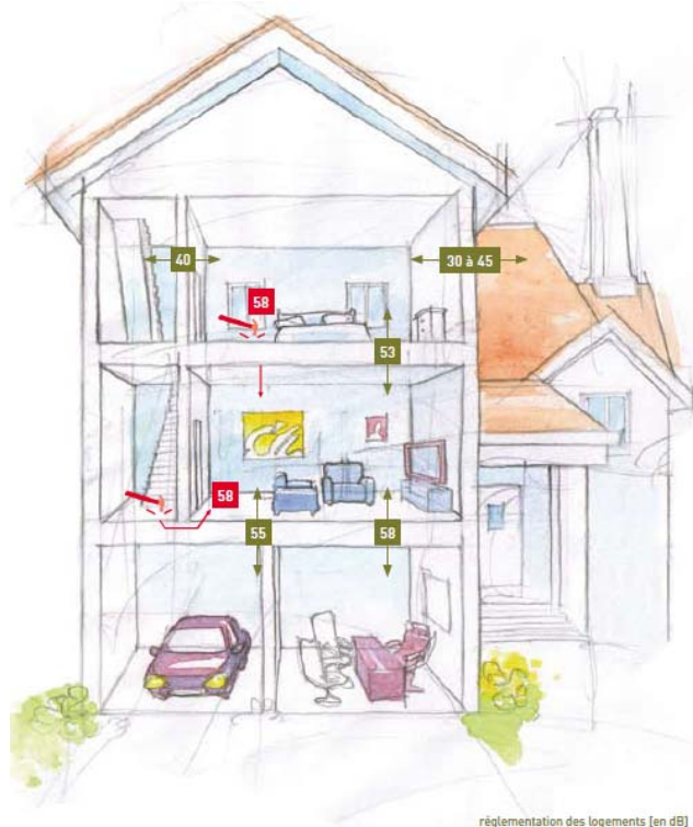
Fig 5 : NRA 2000, illustration du Guide Acoustique ROCKWOOL

*La réglementation : La NRA2000 : voir fig 5