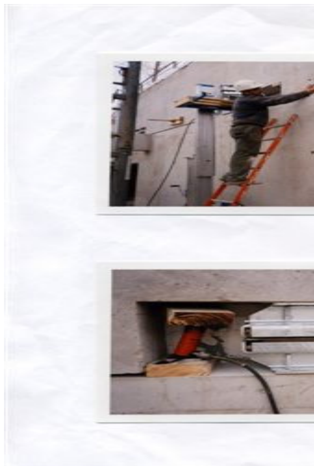
Protection au feu par création de niches bordées de retombées en béton armé