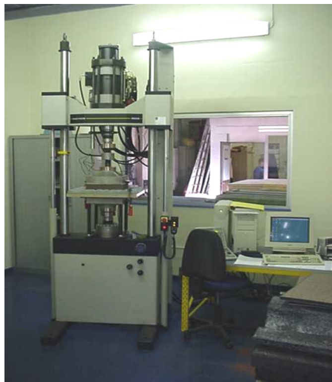
Presse dynamique "Instron 8802"

Les essais sont réalisés sur une presse dynamique "Instron 8802" servant au mesurage des raideurs statiques et dynamiques, du facteur de perte, et de la fatigue du matériau retenu pour chaque projet.