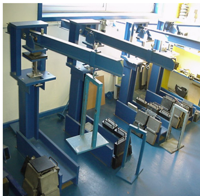
Portique « Cantilever »

L'intérêt de ce test réalisé sur un portique « Cantilever » suivant la norme ISO-8013 est d'appréhender l'évolution des raideurs dynamique et statique du matériau élastique dans le temps et de la maintenir en dessous des valeurs admissibles. A l'instar des matériaux composites tels que le béton, les matériaux CDM sont soumis également au phénomène de fluage. Ne pouvant pas arrêter complètement ce phénomène, il est donc indispensable de le maîtriser. Pour ce faire, la vitesse de fluage admise par la directive BS-6177 depuis 1982 est limitée à 2% par décade de temps. Les produits CDM présentent des valeurs nettement inférieures variant de 0,92 % à 1,2% suivant les différents types de matériaux.