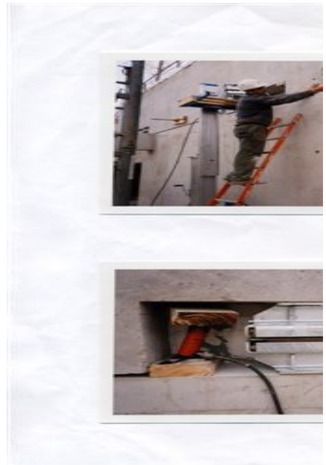
Protection au feu par création de niches bordées de retombées en béton armé