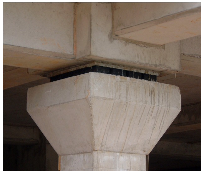
Suspension élastique sur plots en élastomère

Le choix est opté pour une solution à base de plots en élastomère type CDM-83 en 50 mm d'épaisseur proposé par la Société ACOUSYSTEM. Dans le cas où cette atténuation était supérieure à - 15 dB à 63 Hz, la solution la plus appropriée aurait été les ressorts métalliques dont la fréquence de résonance est inférieure ou égale à 4 Hz.