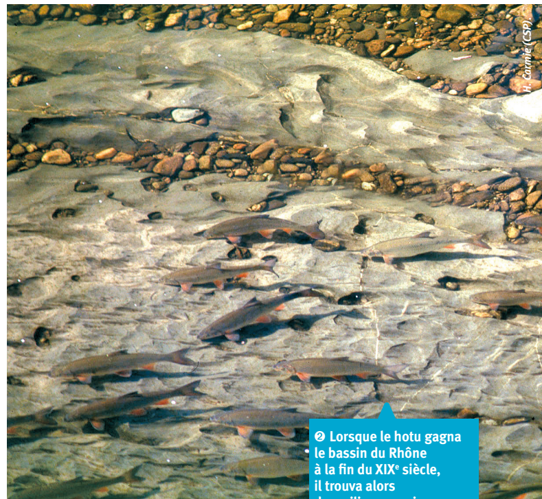
② Lorsque le hotu gagna le bassin du Rhône à la fin du XIX e siècle, il trouva alors des milieux propices pour une véritable explosion démographique.

Le sandre Sander lucioperca , percidé carnassier de grande taille, a profité des éloges de nos pairs, comme Louis Kreitmann. Personne n'avait alors conscience que le sandre était porteur d'un trématode Bucephalus polymorphus (Baer, 1827) dont le cycle nécessite deux autres hôtes obligatoires, un mollusque lamellibranche également en provenance d'Europe centrale, la dresseine ( Dresseina polymorpha ) et un poisson cyprinidé. Ce parasite a été à l'origine de mortalités et d'une extension de la bucéphalose larvaire sur le bassin du Rhône au cours des décennies 1960-1980. L'introduction d'une espèce est en réalité celle d'un système parasite hôte (SPH) d'une extrême complexité, à l'origine de problèmes potentiels insoupçonnés.