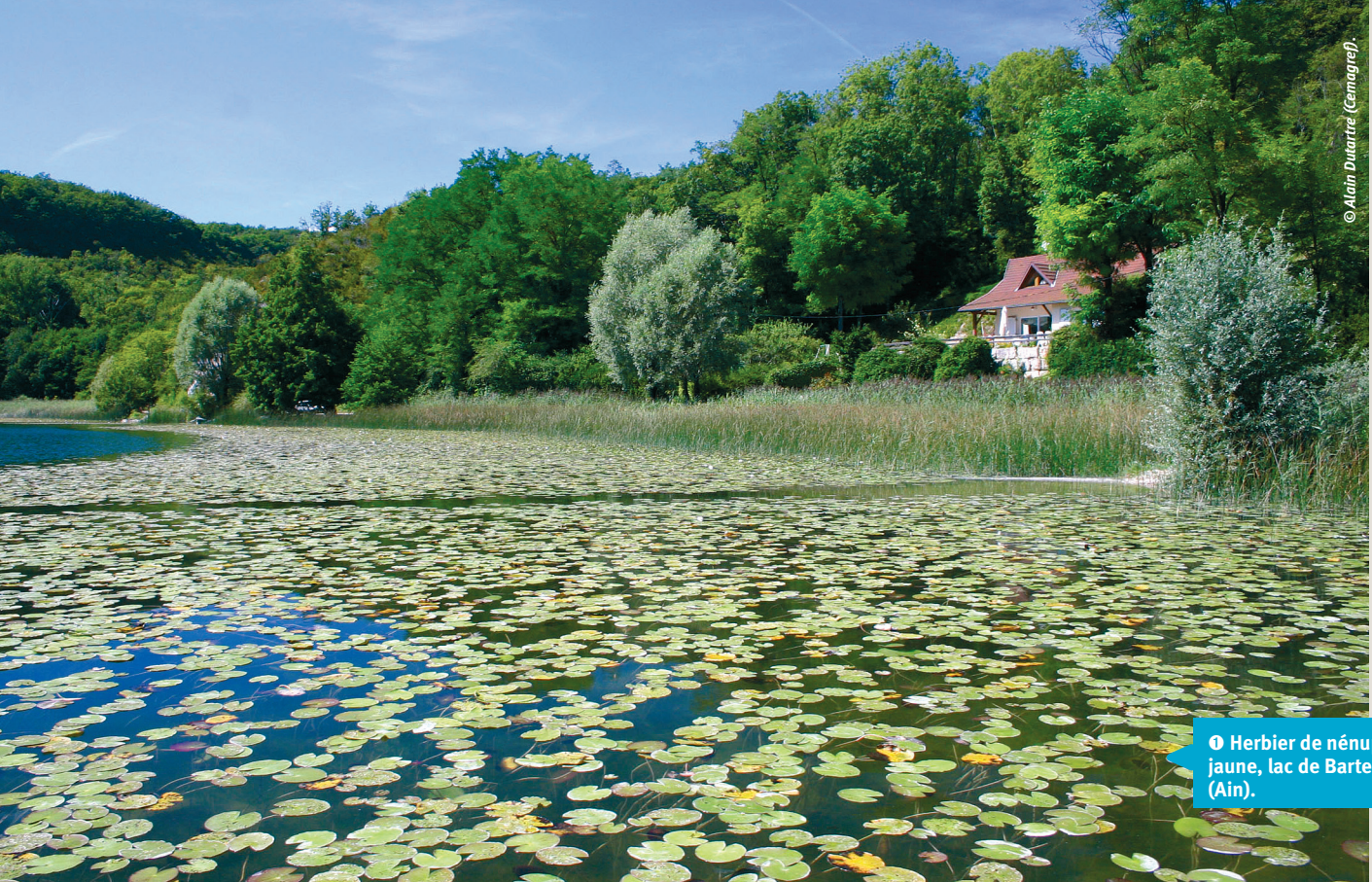
① Herbier de nénuphar jaune, lac de Barterand (Ain).

Cependant, la majorité des longues chroniques portant sur les invertébrés aquatiques ont été acquises au droit des centres nucléaires de production électrique (CNPE), telle que celle de Bugey (Haut-Rhône) initiée en 1975, poursuivie selon un protocole inchangé depuis cette époque. L'analyse fonctionnelle des peuplements a mis en évidence un changement graduel des communautés. Globalement, il résulte essentiellement d'une augmentation de la richesse spécifique avec l'arrivée de sept taxons allochtones, de l'ensemencement par de nombreux taxons limnophiles, notamment des mollusques en provenance des retenues amont, et de la hausse progressive des effectifs d'espèces initialement peu abondantes. Cette évolution temporelle est liée, entre autres, au réchauffement du fleuve, à la modification à large échelle des conditions hydrauliques par la poursuite de l'aménagement du Haut-Rhône entre 1980 et 1986, et aux modalités de gestion des débits.