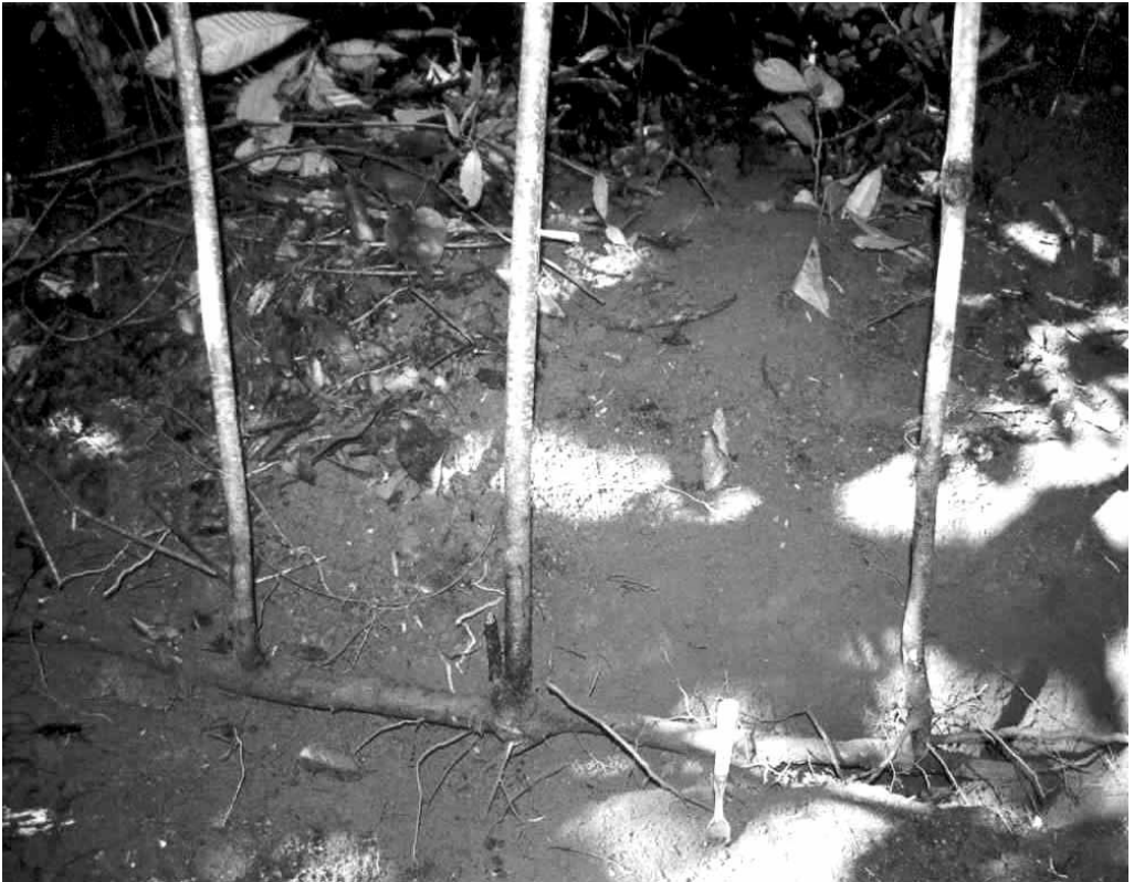
Figure 3. — Racine traçante et drageons de Litsea glutinosa , dans le massif forestier de Sohoa.

Des excavations en milieu anthropisé (bords de chemins très fréquentés) ont révélé une individualisation précoce (sans toutefois formation de pivot) importante de petits drageons (hauteur < 1 m). Cet affranchissement peut être constaté par la décomposition de la racine traçante encore en place ou par ses restes accrochés au drageon.