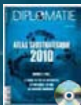
hors-série n° 10 ATLAS GÉOSTRATÉGIQUE 2010