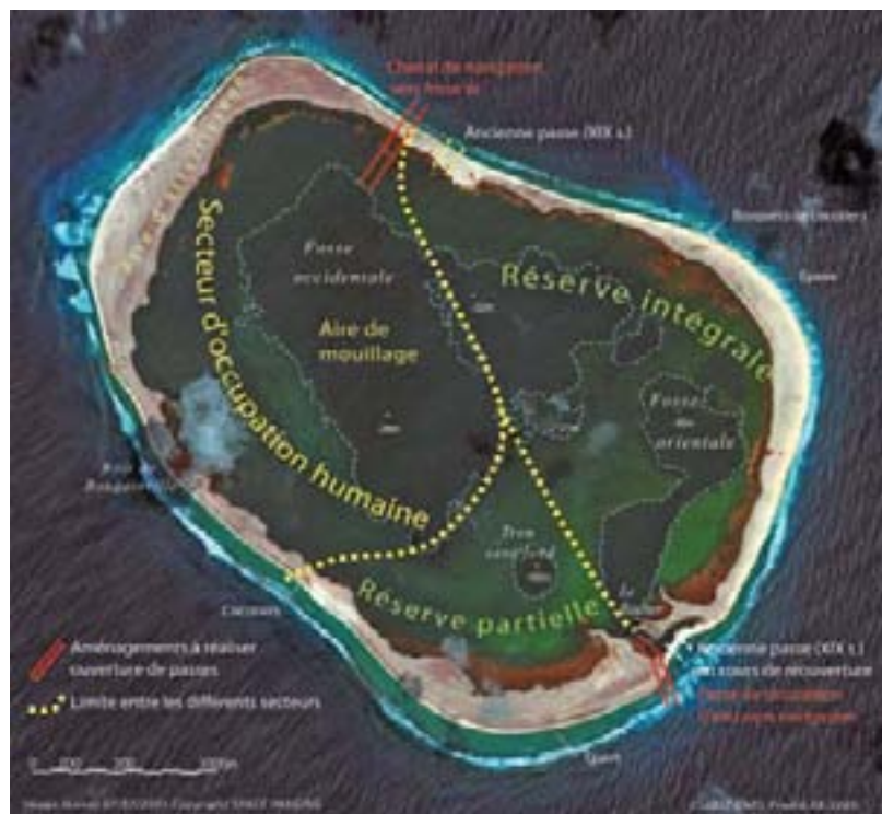
Photo ci-contre : Schéma d'aménagement de l'atoll en trois secteurs après réouverture des anciennes passes dans une perspective d'implantation humaine et de mise en défens d'une Réserve intégrale (couronne entre les deux chenaux) et d'une Réserve partielle expérimentale à usage scientifique exclusif.