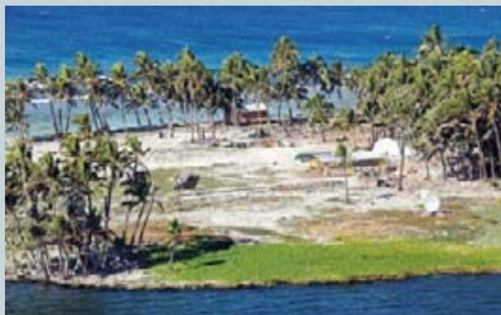
Vue prise en 2005 montrant le village des chercheurs naturalistes dans la cocoteraie de l'atoll de Clipperton. Une couronne de corail blanc sertie de roche basaltique posée sur l'océan Pacifique, un lagon emprisonné et une cocoteraie sous le vent : Clipperton, l'île des fous, tout d'abord baptisée l'île de la Passion, est devenue l'île des savants.

La France et le Mexique signent entretemps, en 1909, une convention s'en remettant à la Cour de La Haye et à l'arbitrage du roi d'Italie Victor-Emmanuel III qui ne rendit son jugement qu'en 1931, attribuant définitivement la souveraineté de Clipperton à la France. Enfin, c'est le 26 janvier 1935 que l'île est déclarée possession française et intégrée aux Établissements français d'Océanie. Depuis cette date, l'île de la Passion n'a accueilli que des missions militaires de courte durée ou des missions scientifiques, hormis pendant la Seconde Guerre mondiale, durant laquelle les États-Unis l'ont occupée