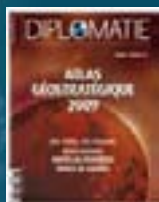
hors-série n° 07 ATLAS GÉOSTRATÉGIQUE 2009