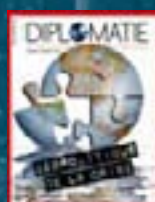
hors-série n° 08 GÉOPOLITIQUE DE LA CRISE