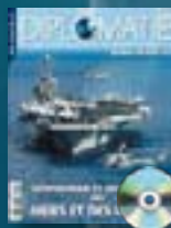
hors-série n° 02 GÉOPOLITIQUE & GÉOSTRATÉGIE DES MERS ET DES OcéANS