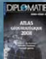
hors-série n° 03 ATLAS GÉOSTRATÉGIQUE 2008