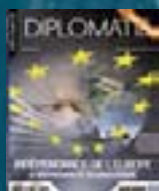
hors-série n° 01 INDÉPENDANCE DE L'EUROPE & SOUVERAINETÉ TECHNOLOGIQUE