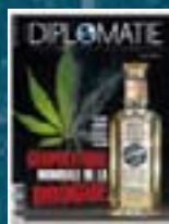
hors-série n° 11 GÉOPOLITIQUE MONDIALE DE LA DROGUE