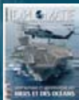
hors-série n° 13 ATLAS DES MERS ET DES OcéANS 2010

Retrouvez les sommaires détaillés sur diplomatie-presse.com