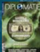
hors-série n° 05 GUERRE & INTELLIGENCE ÉCONOMIQUES