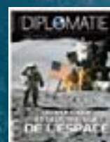
hors-série n° 09 GÉOPOLITIQUE & GÉOSTRATÉGIE DE L'ESPACE