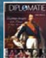
hors-série n° 06 LA POLITIQUE ÉTRANGÈRE DE LA FRANCE DU MOYEN ÂGE À NOS JOURS