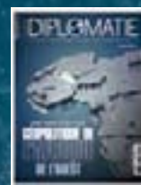
hors-série n° 12 GÉOPOLITIQUE DE L'AFRIQUE DE L'OUEST