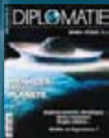
hors-série n° 04 MENACES CONTRE LA PLANÈTE