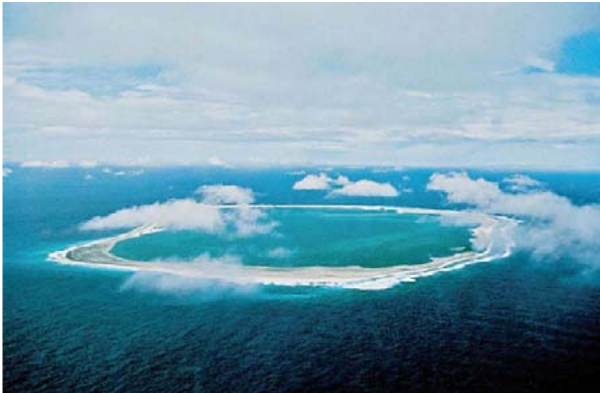
Photo ci-contre : Vue aérienne non datée de l'île de Clipperton située dans l'océan Pacifique Est par 10°18' Nord et 109°13' Ouest, à plus de 6 000 km de Tahiti et à 1 300 km des côtes du Mexique.