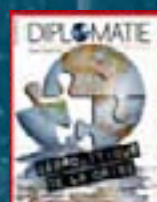
hors-série n° 08 GÉOPOLITIQUE DE LA CRISE