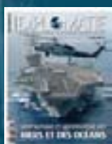
hors-série n° 13 ATLAS DES MERS ET DES OCÉANS 2010

Retrouvez les sommaires détaillés sur diplomatie-presse.com