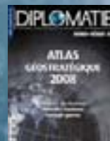
hors-série n° 03 ATLAS GÉOSTRATÉGIQUE 2008