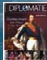
hors-série n° 06 LA POLITIQUE ÉTRANGÈRE DE LA FRANCE DU MOYEN ÂGE À NOS JOURS