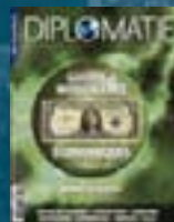
hors-série n° 05 GUERRE & INTELLIGENCE ÉCONOMIQUES