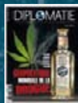
hors-série n° 11 GÉOPOLITIQUE MONDIALE DE LA DROGUE