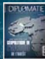
hors-série n° 12 GÉOPOLITIQUE DE L'AFRIQUE DE L'OUEST