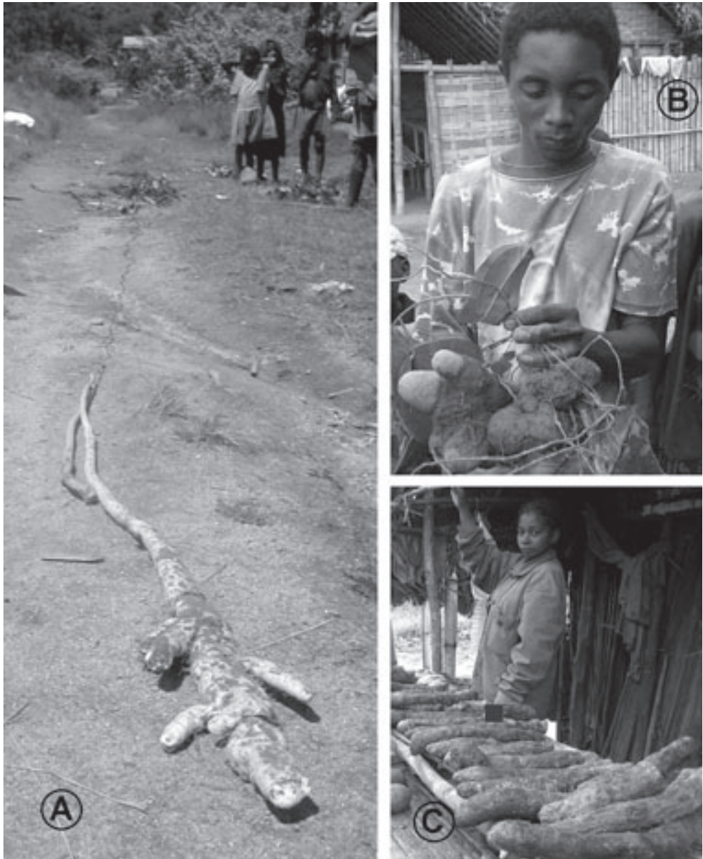
Figure 4. — Exemples d'ignames de la région de Brickaville : une espèce endémique de forêt dense humide, Dioscorea seriflora (A), dont le tubercule, fort apprécié, est devenu rare autour des villages; une espèce introduite, D. cayenensis (B), peu utilisée actuellement; et le cultivar le plus courant de D. alata , ovibe (C), vendu sur le bord de la route.

La densité d'une igname entretenue par l'homme ( D. alata , ovibe ) est plus remarquable car elle est présente sur toutes les parcelles analysées et atteint localement 1 720 pieds à l'hectare, ce qui correspond à un rendement annuel de 5 à 6 tonnes de tubercules. Les autres variétés de D. alata sont beaucoup plus dispersées, de même que D. cayenensis ( ovihazo ). Enfin certaines ignames ont été observées exclusivement auprès des habitations : c'est le cas notamment des cultivars de D. alata boganomby et lohamboay ainsi que de l'espèce D. esculenta .