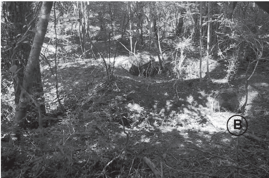
Figure 2. — Utilisation d'une igname endémique de collecte, Dioscorea maciba , dont les tubercules cuits sont vendus sur le bord de la route dans la région de Morondava (A) et aspect des lieux de récolte, avec de nombreuses excavations du sol (B) dans une forêt sèche de l'ouest de Madagascar.