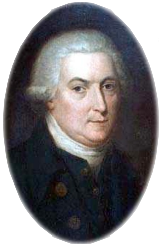
George Vancouver 1757 - 1798

suivi cette vallée, le 23 mai 1887, à 12h46, la locomotive 374 de la Canadian Pacific Railways entra en gare de Vancouver. Parti de Montréal, le convoi avait mis 5 jours, 18 heures et 46 minutes pour traverser le continent. Le passage du nord-ouest s'ouvrait enfin, provoquant l'essor de la ville qui portait son nom, dans cette baie qui lui avait semblé si effrayante de désolation lorsqu'il y avait pénétré ■