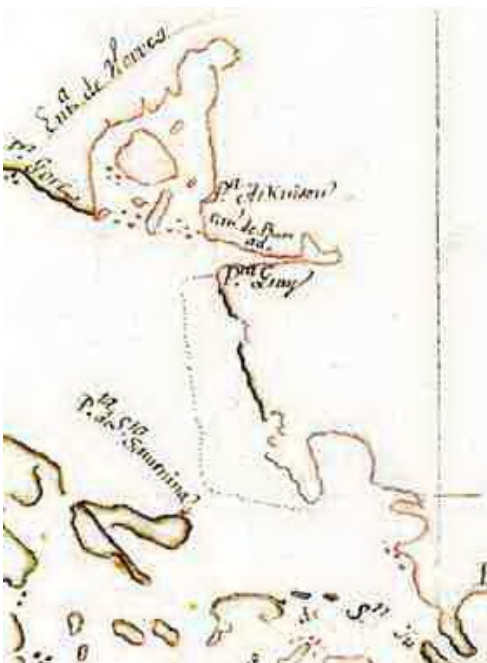
Carte dressée par Juan Francisco de la Bodega y Quadra après la rencontre avec Vancouver. Les contours marron sont ceux relevés par les navires espagnols et les contours en rouge sont ceux relevés par Vancouver

Pendant la traversée, Vancouver s'enferme dans sa cabine, des heures durant, face à ses cartes. Elles marquent la passe de de Fuca et celle de de Fonte, complétées des relevés opérés par Cook, mélange de réel plus ou moins précis et de vides comblés sur la foi de récits imaginaires. L'une d'entre elles vient de John Meares. Elle se démarque des autres par une étrangeté. Il y est en effet indiqué qu'un navire américain, le Washington , serait entré dans une passe, au sud des îles Queen Charlotte, pour ressortir plus bas dans l'océan par la passe de de Fuca.