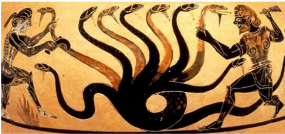
Hercule et l'Hydre de Lerne

Il faut se résoudre à abandonner la conceptualisation anthropomorphique du collectif, dont l'une des personnifications les plus abouties est celle analysée par Kantorowicz dans Les deux corps du roi (1957, cité par Teubner, 1996). La personnification du collectif, comme association d'un corps et d'une tête pensante, qui exerce le contrôle sur le reste de l'organisme, nous empêche de penser la réalité, la singularité d'une forme collective telle que le réseau. Selon Teubner, « l'invention de la personne juridique doit, en fait, être considérée comme le grand apport culturel du droit à la révolution organisationnelle des temps modernes, au cours de laquelle l'attribution de la capacité d'agir fut étendue de l'homme aux processus de communication » (Teubner, 2001, p. 96).