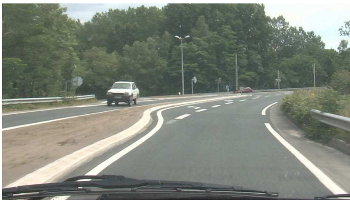
Figure 1 : Exemple d'intersection en T aménagée

Trente deux séquences ont été réalisées. La moitié des intersections sont aménagées et réparties en 2 sous-groupes en fonction de la matérialisation des voies de tourne à gauche : terre-plein ou marquage au sol. L'autre moitié des intersections ne sont pas aménagées et réparties en 2 sous-groupes selon leur degré de visibilité : perception correcte ou tardive (virage, haut de côte ou présence de végétation). Dans chacun de ces 4 sous-groupes ont été distinguées les intersections en X et les intersections en Y. On dispose ainsi de 4 films par configurations d'intersection, correspondant à 2 situations où le conducteur peut s'engager et 2 situations où le conducteur doit temporiser.