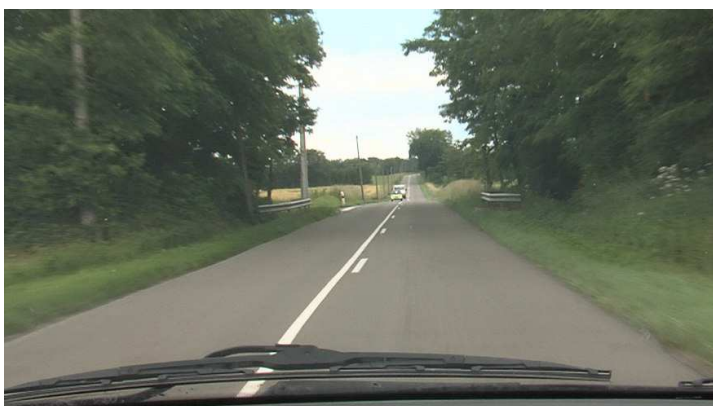
Figure 2 : Exemple d'intersection en T non aménagée