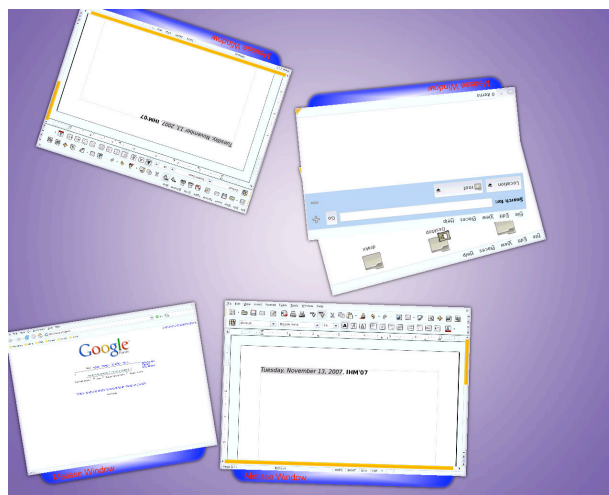
Figure 2 : Plusieurs applications existantes (Firefox, Nautilus et OpenOffice) ouvertes par deux utilisateurs. Le document OpenOffice est partagé.

Le serveur X de Metisse rend accessible les images des fenêtres par une connexion réseau. Nous avons donc implémenté un module client pour DiamondSpin [10], une boîte à outils open-source pour table interactive. Du point de vue du serveur Metisse, notre module est un compositeur qui va récupérer les images des fenêtres et générer des événements clavier et souris. Le protocole de communication entre le serveur Metisse et le compositeur est dérivé du protocole RFB : les mises à jour des fenêtres (on ne pas seulement du Frame Buffer) sont envoyées sous la forme d'images rectangulaires correspondants à la plus petite zone englobant la modification. Ces images sont récupérées et stockées par DiamondSpin dans des textures OpenGL, qui les positionne ensuite de manière appropriée par rapport aux utilisateurs (orientées dans le sens de lecture de l'utilisateur qui manipule la fenêtre, ...) et les affiche sur la table.