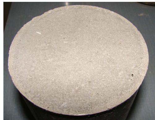
FIGURE 2 – Exemple d'un échantillon de liant à base de chaux aérienne - Diamètre 10 cm

La porosité des échantillons de liants fabriqués est située autour de 50%, leur résistivité s'avère très forte, de l'ordre de 3.10^6 Nm^{-4}s . D'un point de vue acoustique, ces liants s'avèrent peu intéressants, étant denses et fermés en surface, et par conséquent très réfléchissants (voir Fig. 2).