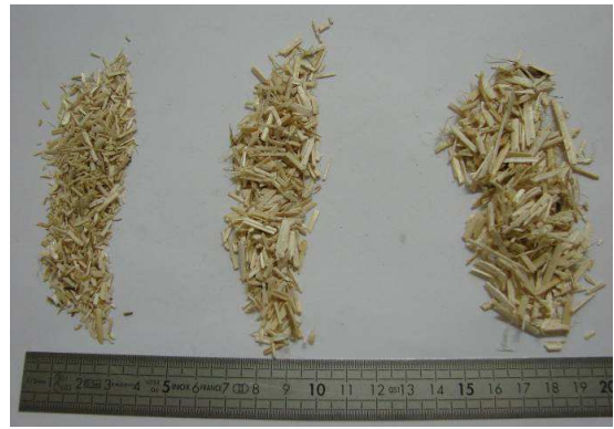
FIGURE 1 – Présentation des chènevottes étudiées

Selon leur densité, les chènevottes peuvent présenter une porosité comprise entre 80 et 90%, répartie entre des