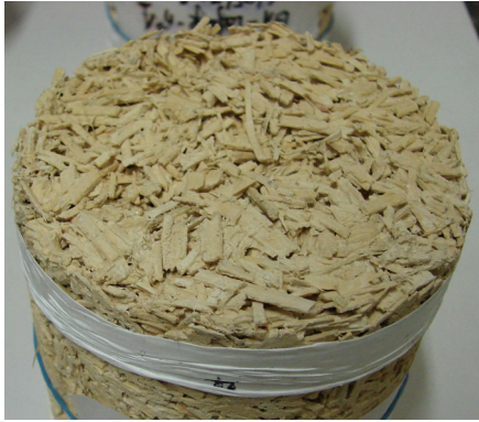
FIGURE 3 – Un exemple de béton de chanvre réalisé à partir d'une chaux hydraulique - Diamètre 10 cm

coefficients d'absorption qui dépassent 0,5 sur une large gamme de fréquences, ce qui leur donne des propriétés plus intéressantes que de nombreux matériaux utilisés dans le domaine du bâtiment (voir Fig. 3).