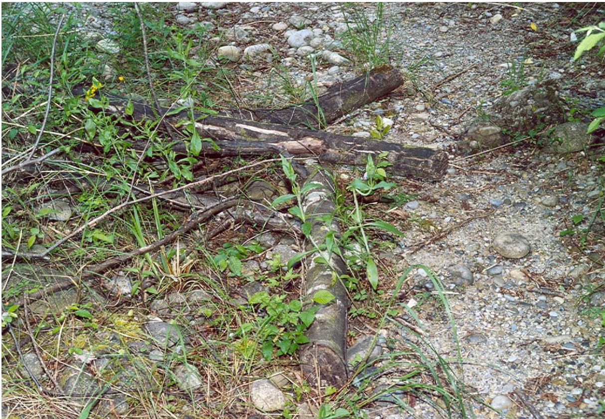
Bois coupé (charme-houblon), non décomposé en l'absence de réseaux trophiques (Vallon de Donaréo, Point 4)

Le développement du charme-houblon constitue un compromis intéressant entre l'ouverture du milieu (liée aux phénomènes d'éboulement) et à l'absence de réseaux trophiques dans les zones les plus resserrées et dépourvues de végétation. L'ombrage très important réalisé par le charme-houblon compense dans une certaine mesure le réchauffement provoqué par les éboulements. Dans les zones les plus étroites, il couvre souvent le haut des canyons et réalise ainsi des apports de litière indispensables au maintien de l'activité biologique du sol. Le groupe des Diplopodes semble nettement favorisé par les boisements de charme-houblon, et une grande diversité d'espèces de ce groupe a pu être rencontrée. La partie basse du vallon de Donaréo a été largement déboisée, sans doute dans le souci de «nettoyer» le vallon. Il s'agit d'une erreur manifeste. Aucun humus ne subsiste dans de telles zones déboisées, et le bois mort ne s'y décompose pas, du fait de l'absence quasi totale de réseaux trophiques susceptibles de le recycler. La photo ci-dessous illustre ce phénomène.