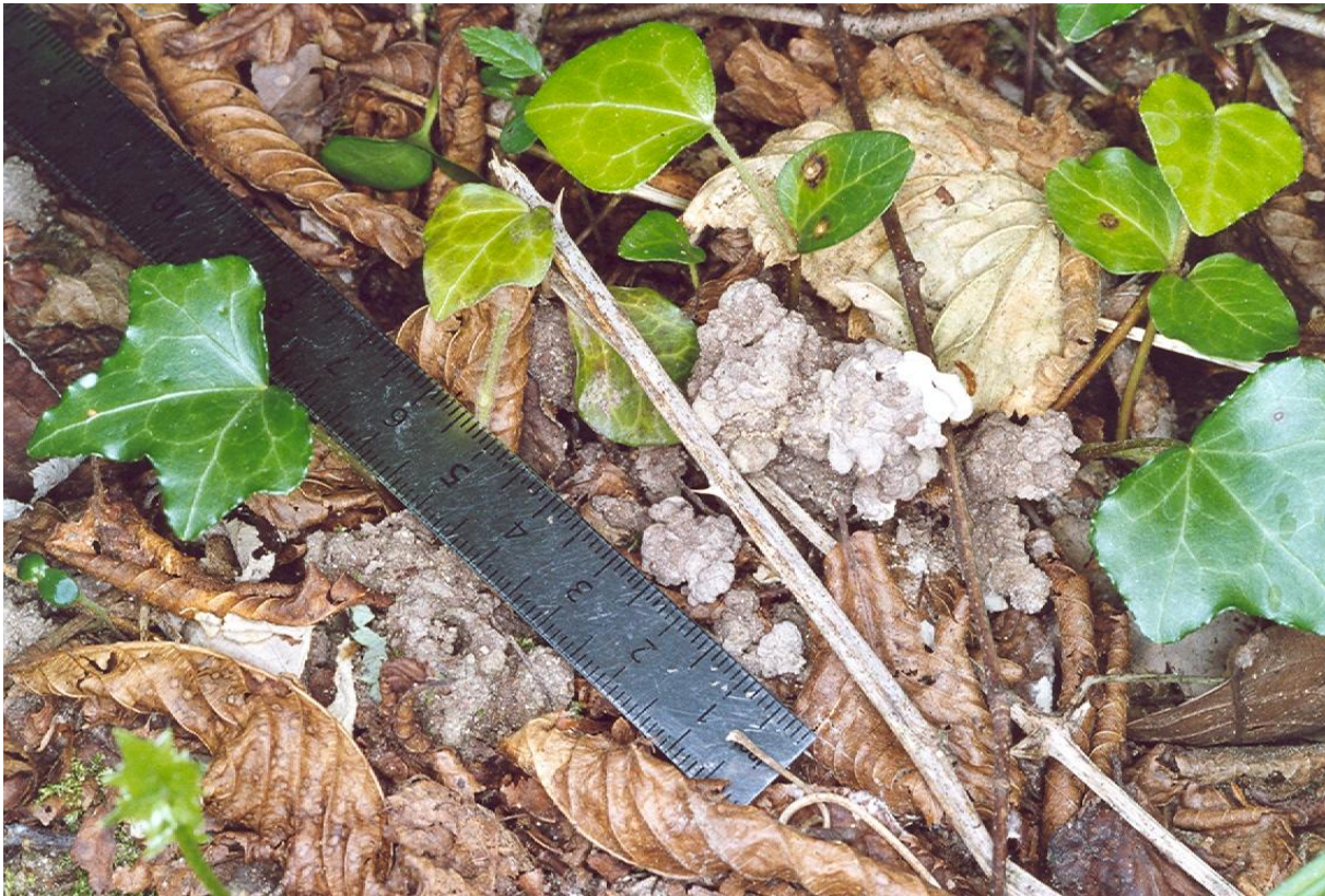
Turricules de vers de terre au sein de la litière (Vallon de Saint-Pancrace, Point 28)

à la macrofaune saprophage, constituée d'invertébrés de taille supérieure ou égale au centimètre qui dégradent activement la litière, en la transformant en déjections de taille supérieure au millimètre, visibles à l'œil nu sur le terrain. Certaines catégories de vers de terre, typiques des Mull, ainsi que certains Diplopodes (Myriapodes), incorporent la matière organique à la matière minérale, réalisant des structures stables, riches en éléments nutritifs, favorables à la nutrition végétale, en particulier celle de la strate herbacée. En milieu forestier, les zones à Mull sont reconnaissables à la présence d'un tapis continu de lierre et une riche flore printanière.