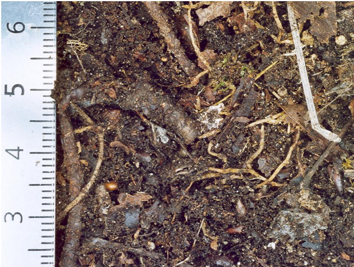
Accumulation de matière organique fine (déjections d'enchytréides et de microarthropodes) à la base de la litière (Vallon de Magnan, Point 14)

s'accumule à la base de la litière, pouvant former dans le cas des Dysmoder des horizons épais de plusieurs centimètres. Ces horizons d'accumulation de matière organique transformée par la faune (humifiée) sont également caractérisés par la présence de nombreuses racines d'arbres et de nombreux filaments de champignons.