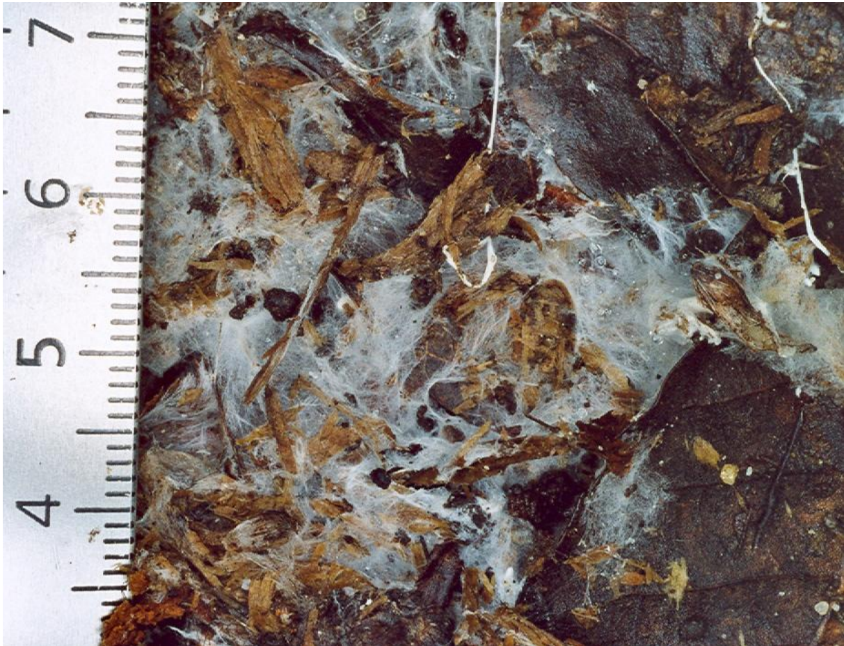
Développement de mycélium au sein d'une accumulation de litière non décomposée (Vallon de la Gorguette, Point 6)

L'apparition des formes Mull, Moder et Mor suit des lois encore non complètement élucidées, faisant intervenir de nombreuses interactions entre organismes végétaux, animaux et microbiens. On peut les définir comme des stratégies écosystémiques, correspondant à des réponses variées aux contraintes environnementales (PONGE, 2003). Si l'on considère le Mull comme l'optimum de biodiversité fonctionnelle (diversification des organismes, circulation rapide des nutriments), toute atteinte au fonctionnement biologique (sous l'influence du climat, de la minéralogie, de la pollution, de la gestion), va se traduire par un ralentissement de l'activité des organismes les plus exigeants (tels que les vers de terre), la disparition de certaines niches écologiques, dans une réaction en chaîne inéluctable jusqu'à ce qu'un nouvel équilibre soit atteint. Par exemple, le long d'un gradient altitudinal, on observera une succession des formes d'humus, depuis le Mull en bas de pente, jusqu'au Mor en haut de pente, en passant par le Moder, en position intermédiaire (PONGE et al., 1998). Le long d'un gradient de pollution, on observera une succession similaire, avec des sauts correspondant à des seuils de tolérance des organismes-clés (GILLET & PONGE, 2002). L'existence de changements réversibles de la forme d'humus en fonction des modes d'utilisation du sol (TOPOLIANTZ et al., 2000) permet de préconiser des méthodes de gestion conservatoires des réseaux trophiques.