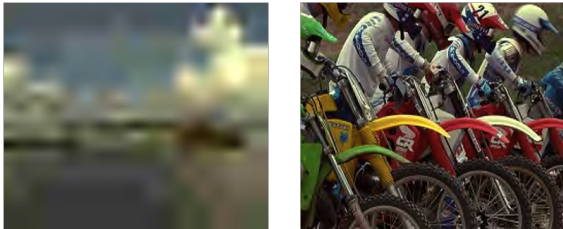
Figure 1 – deux images avec un PSNR de 24dB

MSE, SNR, RMSE, PSNR sont purement mathématiques, basées sur une comparaison pixel à pixel dans l'espace RVB. La métrique Peak Signal to Noise Ratio (PSNR) est la plus connue et la plus utilisée, grâce à son implémentation simple et son exécution rapide. Cependant le PSNR montre une faible corrélation avec le jugement humain sur certaines images (figure 1). De nombreux travaux visent à développer des métriques plus proches de la perception humaine.