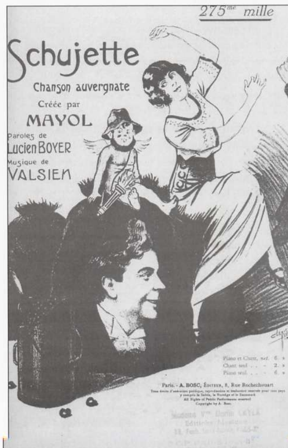
Fig. 2 : Schujette , "Chanson auvergnate". Petit Format

sont ignorés des anthologies "sérieuses", on prendra la mesure de leur popularité de nos jours en consultant