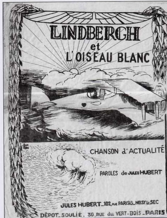
Fig. 3 : Lindbergh. Placard

Le thème de l'aviation reparaît dans son répertoire lorsqu'en 1927 Lindbergh effectue le premier vol transatlantique en