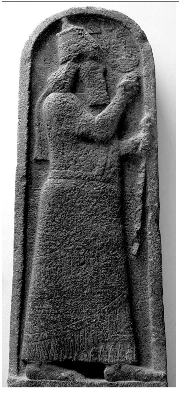
183. Stele di Sargon II da Larnaca. Berlino, Vorderasiatisches Museum, inv. n. VA968.