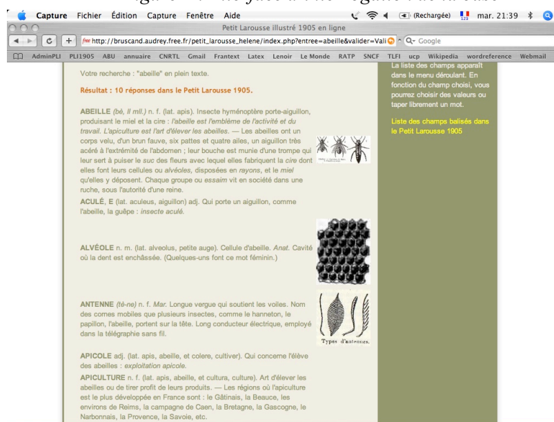
Figure 2 : Résultat de la recherche plein texte du mot « abeille »