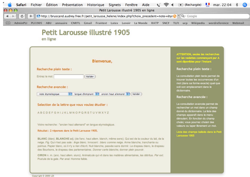
Figure 3 : Résultat de la recherche sur les mots ayant l'ancien haut allemand pour origine