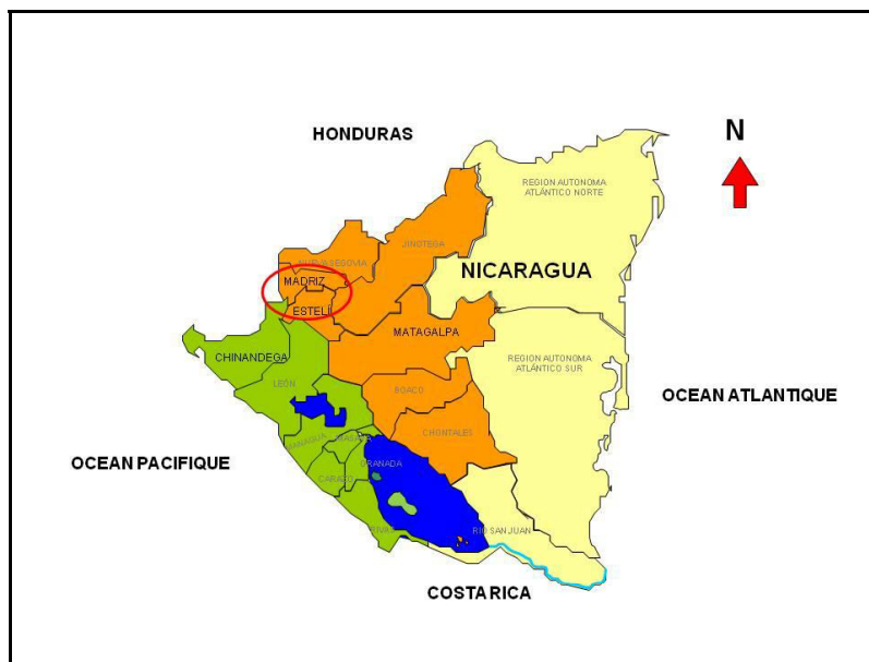
Carte 1. Zone d'intervention du projet sélection participative sorgho au Nicaragua

Dans cette zone, un premier diagnostic approfondi a fait ressortir une demande des agriculteurs pour l'amélioration de trois types de sorgho cultivés localement, les sorghos millón 1 , tortillero 2 et escoba 3 (Martínez Sanchez, 2002; Trouche et al., 2006). Le programme de recherche a ainsi commencé à travailler sur ces trois types, en utilisant l'approche de sélection variétale participative (en anglais Participatory Variety Selection-PVS), et en ayant recours à une large diversité de variétés et lignées existantes, notamment parmi celles développées par le Cirad et ses partenaires en Afrique de l'Ouest pour des écosystèmes similaires (climat semi-aride et sols de faible fertilité). Chemin faisant, les critères de sélection pour chaque type de sorgho ont pu être définis sur la base i) des contraintes et objectifs de production des systèmes de culture cible, ii) des observations des agriculteurs par rapport aux nouveaux types de plante évalués sur le terrain et iii) de la confrontation entre les phénotypes préférés et leurs performances agronomiques mesurées in situ . Dans ce cas, trois saisons de culture ont été nécessaires pour co-définir précisément les idéotypes variétaux. Cette approche PVS a fourni des résultats probants; elle a permis d'identifier et diffuser plusieurs variétés des types millón et tortillero, dont une, Blanco Tortillero, a été officiellement inscrite au catalogue variétal national (Trouche et al., 2008).