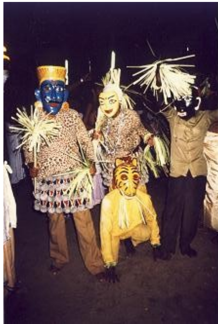
Chattan est lui-même entouré de Bhutas

part d'une certaine inflation verbale, Chattan est un dieu "complet". La même remarque s'appliquerait à bien des divinités des castes de bas statut. Ainsi dans le Travancore, Duryodhana est-il le "Grand-père" ( Appuppan ) et Dusassana le "Petit grand-père" ( Koccu appuppan ) de plusieurs castes d'intouchables. Ils mènent la horde des "Dieux-montagnes" identifiés aux Kauravas. Leur culte répond autant à des buts immédiats qu'à une dévotion comparable à celle qui est accordée, par d'autres, aux "grands dieux". Ce sont les dieux de ces gens, qui se reconnaissent dedans, et ils sont donc à leurs yeux "complets" même si les castes de statut supérieur considèrent ces "Dieux-montagnes" comme de cruels Bhutas (observation similaire, à propos du culte du Teyyam dans le nord du Kérala, où les appellations /p.67/ n'ont pas exactement le même sens ; cf. Rao 1985 : 2 -"Les basses castes au Kérala considèrent Bhagavati, Chamundi comme des déesses alors que les hautes castes les traitent comme des esprits"). 16