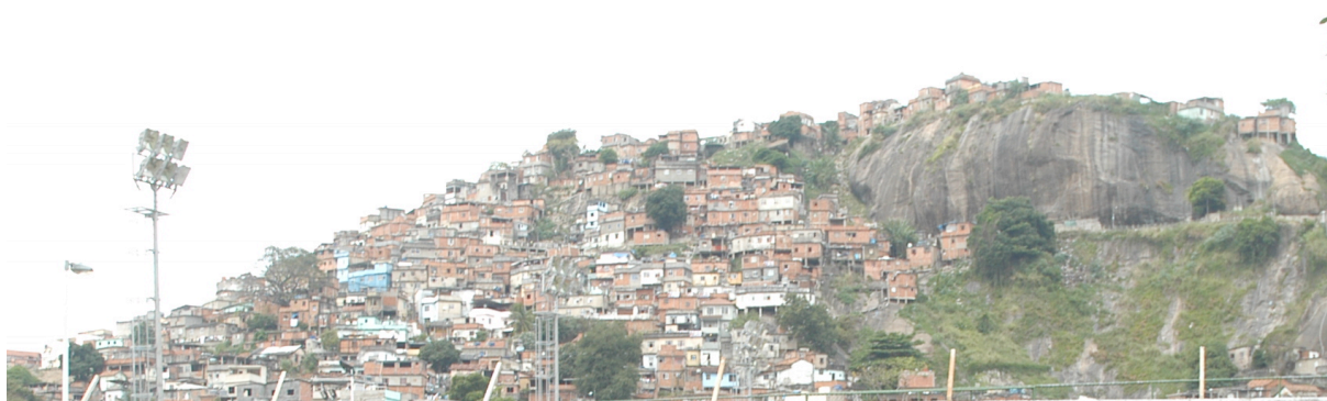
Doc. 1 Favela Morro da Providência

A hipótese central de nossa reflexão é que o sistema sócio espacial da favela, constituído de forças opostas, encontra-se paradoxalmente reforçado pela intervenção pública, isto é, possuindo então uma característica resiliente. Esta resiliência pode ser identificada como uma característica determinante do sistema de atores da favela. Em estudo, permitindo ao mesmo tempo reconhecer a importância da atuação pública na favela e limitar a dependência da sociedade favelada à intervenção do poder público. Esta limitação é possível através da mobilização, por alguns atores, de uma posição intersticial, ou seja, da adoção de estratégias - lícitas ou ilícitas - desenvolvida fora do âmbito do projeto e/ou fora dos quadros normativos. Apesar de serem marginais e instrumentalizadas através da falta de participação popular (FERNANDES & GOMES, 2007), algumas iniciativas de atores envolvidos no Morro da Providência usam os pontos fracos do projeto de urbanização e de revitalização da favela para gerar processos alternativos que utilizam a iniciativa municipal para mediatizar as suas próprias iniciativas, que emergem principalmente fora do controle público. Deste modo, os atores envolvidos materializam uma capacidade nova de resistência às políticas urbanas que tendem gerar novas segregações dentro do espaço da favela.