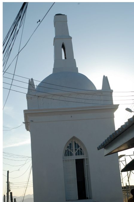
Doc. 2 Capela do Cruzeiro, antes e depois da obra Favela Bairro, Morro da Providência

Duas razões explicam a falta de apropriação do projeto pelos moradores: em primeiro lugar, porque a favela « não interessa aqueles que moram aqui » (N.H, entrevista). Esta afirmação ilustra a falta de implicação que caracteriza a posição de uma grande parte dos moradores da favela em torno aos projetos que investem em mudanças do seu espaço de vida: a favela. Isso pode ser explicado pela relativa ausência do poder público na atuação local que caracterizou as décadas anteriores, provocando uma fraca credibilidade das intervenções públicas.