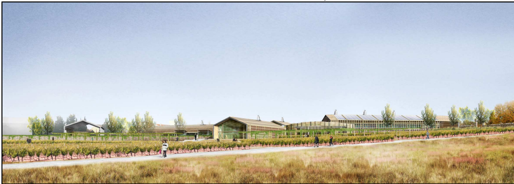
Figure 2 : vue du futur pôle œnotouristique de St Christol (source Internet cabinet d'architecture Madec)

Que se soit dans la dimension juridique ou sociale, la dimension projet est au cœur des dynamiques engendrant une publicisation, c'est pour cela qu'une dimension politique est au cœur de ce processus.