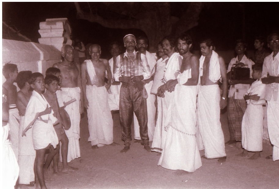
Le groupe ouest se prépare à entrer pour la scène du « travailleur du cuir » ( cakkīliyar ) ; le Maître principal de jeu est à main droite du danseur costumé. Pallassena, 1983

Le texte des chants est préservé, dit-on, sur des manuscrits de palme (qui n'ont pu être consultés) aux mains des Maîtres. Durant la représentation, ils s'aident en fait de cahiers où les paroles ont été recopiées (ou éventuellement recomposées). La formation des participants dont ils ont la charge est orale, et les dialogues sont dans une large mesure improvisés sur un canevas. Dans le cas de troupes professionnelles de pāṇan , K. Visvam (1979 : 17) indique que certains Maîtres ne savent ni lire ni écrire, mais sont capables de composer ex tempore une farce sur tout sujet d'actualité. Il s'agit donc d'une tradition bien vivante qui, tout en étant enracinée dans un terroir avec ses références anciennes, est évolutive, et où l'écrit et l'oral s'interpénètrent.