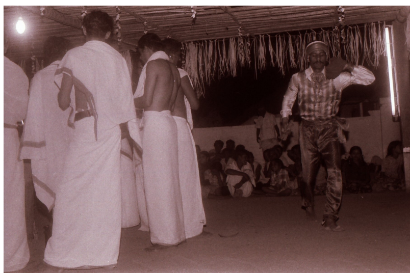
Danse des « travailleurs du cuir » autour des chanteurs. Groupe ouest, Pallassena, 1983