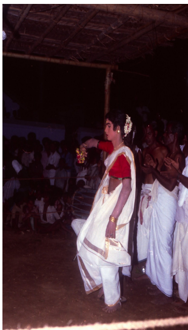
Entrée de la blanchisseuse. Chittur, 1983

Compte tenu des caractéristiques attribuées aux blanchisseurs, il n'est pas étonnant de voir la farce émaillée d'allusions obscènes. La traduction ne permet pas de rendre tous les sous-entendus : il faut garder présent à l'esprit le fait que l'évocation du nettoyage du linge est ici toujours simultanément métaphore de l'acte sexuel. 11 Cela ne doit pas pour autant occulter la diversité des registres émotionnels qui sont mis en oeuvre, et qui se traduisent en ruptures stylistiques.