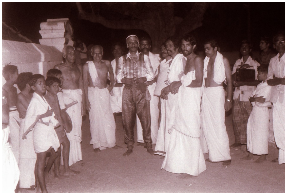
Le groupe ouest se prépare à entrer pour la scène du « travailleur du cuir » ( cakkīiyar) ; le Maître principal de jeu est à main droite du danseur costumé. Pallassena, 1983