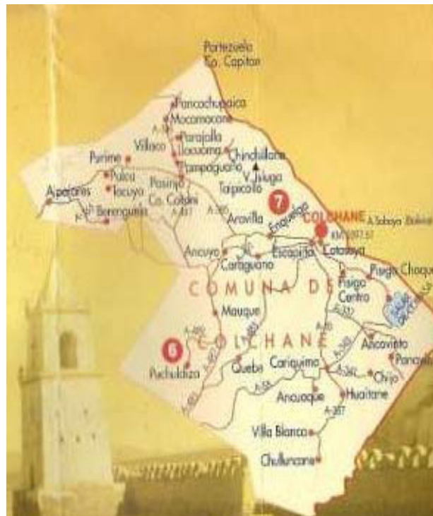
Figure 3 : Commune de Colchane

Le village de Colchane (Colchane-ville par la suite) est plus récent que les autres communautés, vieilles de plusieurs siècles. Il a été fondé à la fin des années 1970 durant le gouvernement militaire qui a installé dans ce poste frontalier administration, infrastructures et institutions (municipalité, jardin d'enfants, école et collège, dispensaire médical...). L'Etat reste le principal employeur de la commune. Les principales activités des populations locales sont l'agriculture, principalement la culture de la quinoa, productions maraichères, et l'élevage de camélidés ainsi que tourisme (accueil, hébergement, artisanat...).