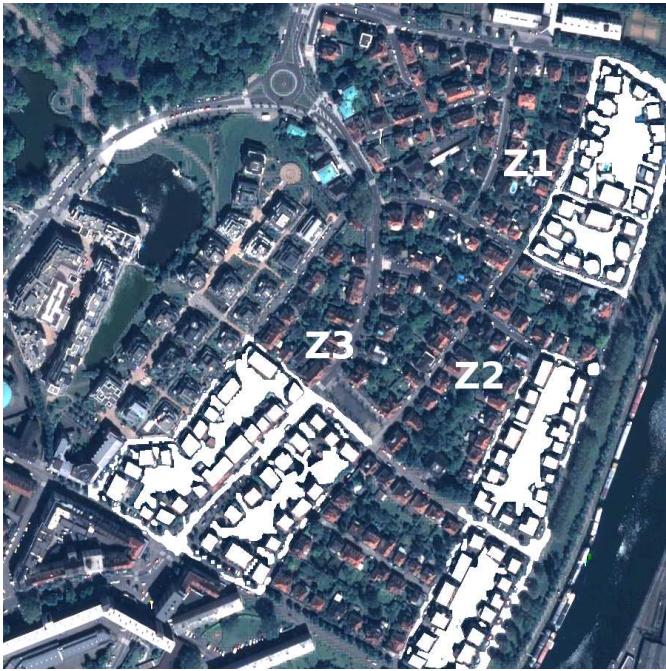
Figure 2: Image de test et ses 3 zones (Z1, Z2 et Z3) d'apprentissage et d'évaluation en surbrillance.

classe n'a pas pu être déterminée (cas des pixels mixtes ou d'objets qui ne sont pas d'intérêt comme les voitures) ne sont pas étiquetés.