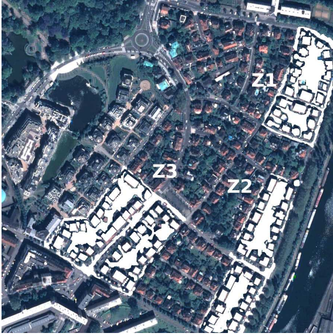
Figure 2: Image de test et ses 3 zones (Z1, Z2 et Z3) d'apprentissage et d'évaluation en surbrillance.

classe n'a pas pu être déterminée (cas des pixels mixtes ou d'objets qui ne sont pas d'intérêt comme les voitures) ne sont pas étiquetés.