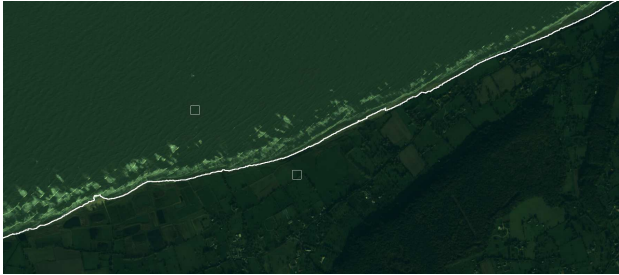
FIG. 3 – Segmentation avec 2 marqueurs (terre et mer) d'une image multispectrale pour l'extraction du trait de côte.

La figure 3 présente quant à elle un exemple de résultat obtenu en télédétection à très haute résolution spatiale, où l'objectif est de fournir un outil d'aide à la localisation d'objets d'intérêt (trait de côte ici, mais aussi bâtiments par exemple). Les résultats obtenus ont convaincu des équipes de géographes d'utiliser cet outil dans leurs travaux en photo-interprétation [10].