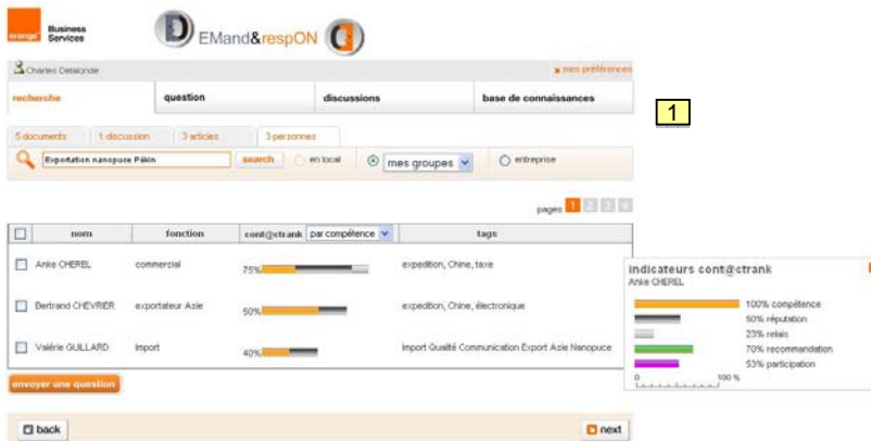
Fig. 3 – Les destinataires sont classés par le Cont@ctRank

Afin de dépasser la [L3] identifiée en 2.2, l'individu sélectionne un ou plusieurs destinataires en spécifiant le niveau de confidentialité du message. Ce dernier restreint la rediffusion de cette requête et sa consultation aux seules personnes sélectionnées initialement. Lorsque la question a été diffusée, DemonD crée automatiquement un espace collaboratif dédié et notifie l'ensemble des destinataires sélectionnés.