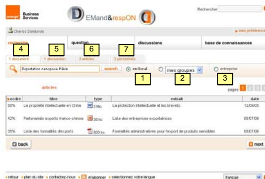
Fig. 2 – Emplacements et types de ressources

L'outil DemonD est intégré dans l'organisation et disponible à l'adresse http://demon.d . L'interface de l'outil présente les sujets d'actualité et les discussions en cours. Après s'être inscrit, l'utilisateur peut effectuer une requête: "Exportation nanopuces Pékin" par exemple. DemonD extrait les mots-clés de cette requête (exportation, nanopuces et Pékin) puis renvoie des documents, des discussions en cours, des articles ou des individus dont le contenu ou le profil contient l'un des "tags" de la requête.