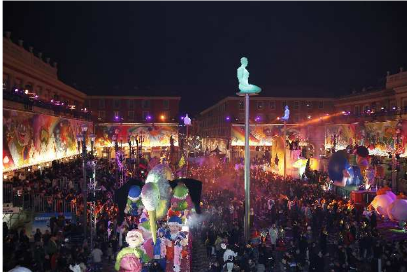
Illustration n°3 Carnaval de Nice 2010 Corso illuminé

Parmi ces évènements, certains sont néanmoins de réputation mondiale et attirent des centaines de milliers de visiteurs (CRT Riviera) comme le festival international du Film de Cannes ou le Carnaval de Nice qui aurait attiré plus de 1 million de visiteurs en février 2010 (cf. illustration n°3 carnaval de Nice 2010 sur le thème : – Roi de la Planète bleue –)