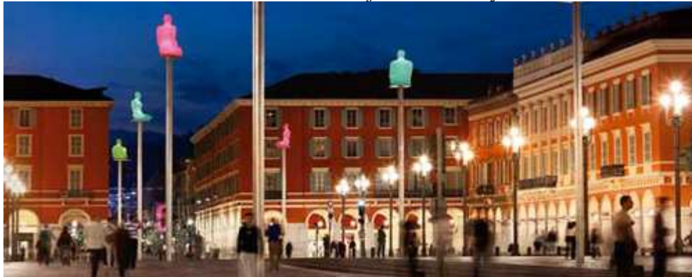
Place Masséna, de nuit.

Illustration n°5 Art dans la ville sur le trajet du tramway : Bouddhas colorés sur pied.