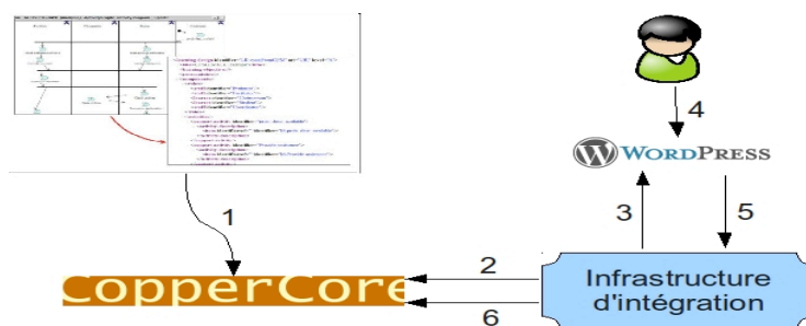
FIG. 3 – Fonctionnement du prototype

Outre la publication du scénario IMS-LD dans CopperCore, il est nécessaire de configurer pour chaque apprenant l'infrastructure d'intégration et les détails nécessaires à la publication.