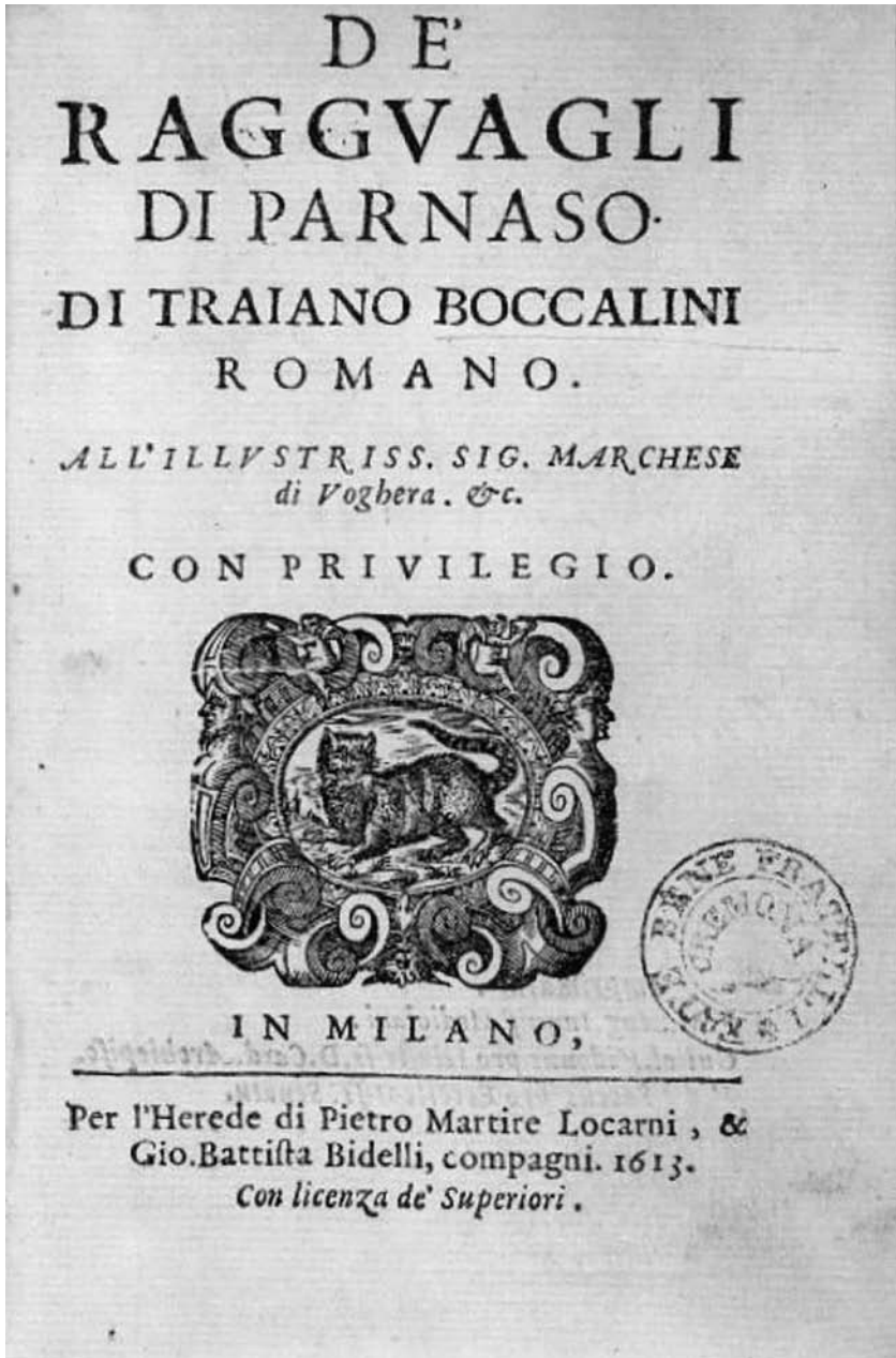
Frontespizio da De' raggvagli di Parnaso di Traiano Boccalini romano... In Milano, per l'herede di Pietro Martire Locarni, & Gio. Battista Bidelli, compagni, 1613 (collocazione Firpo 2564).