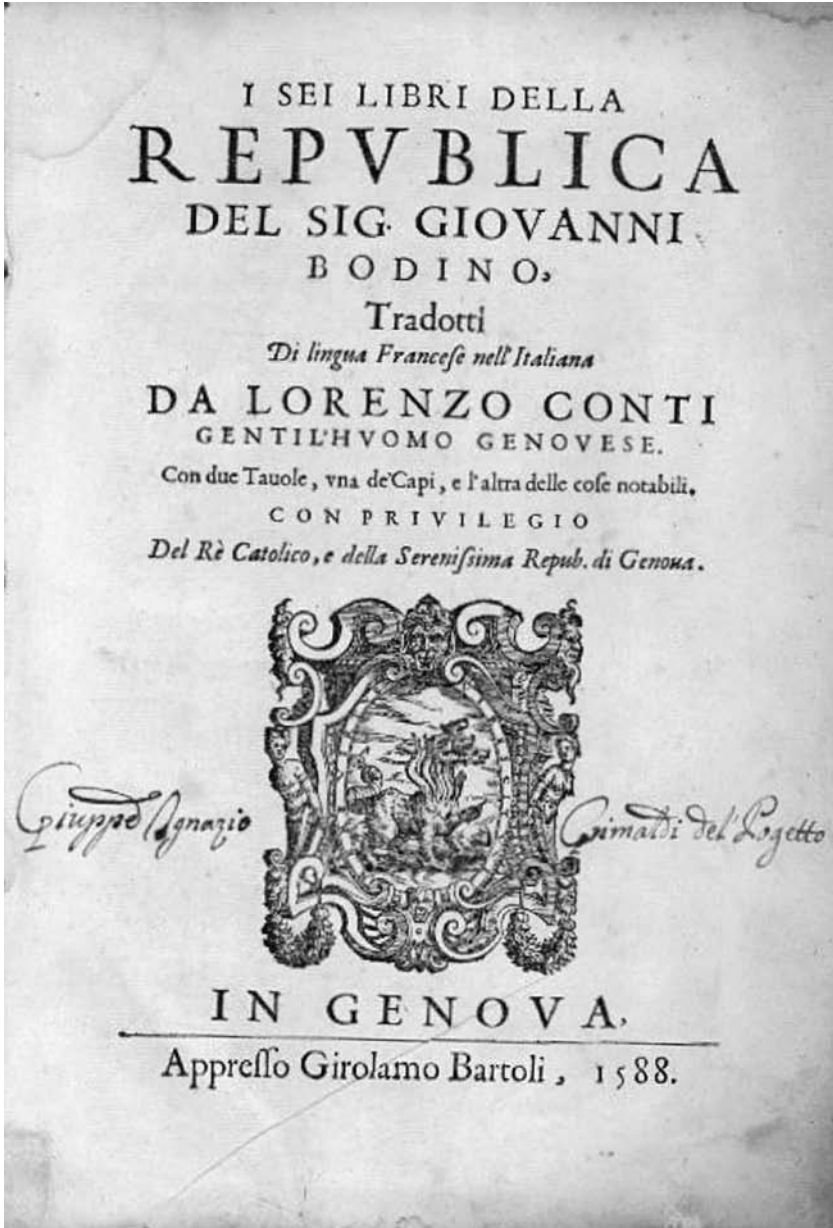
Frontespizio da I Sei Libri della Repubblica del sig. Giovanni Bodino, tradotti in lingua francese nell'italiana da Lorenzo Conti... In Genova, appresso Girolamo Batoli, 1588 (collocazione Firpo 529).